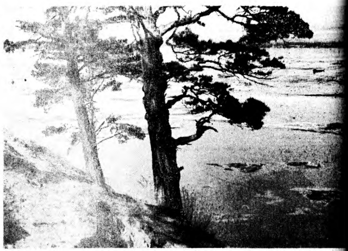
ХАБРАНИ ҮДЭР СӨЛӨНГӨ МҮРЭН ДЭЭРЭ. П. ЯХНОВЕЦКИИ