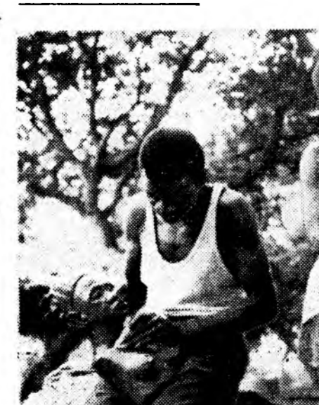
КОНГЫН РЕСПУБЛИКА (БРАЗЗАВИЛЬ). Браззавиль го-родой урашууд — мидондо һинилгээд, ТАСС-ай фото.

ПАРИЖ, апрелин 27. (ТАСС). Фашис Германнэ иһаһаар 20 жэлэй ойн үдэр—эб нэгэдэлэй үдэр, арадудай хоорондо үгээс ойгодоһоһыс, эрхэ сүлөөтэй, амгалан тайван ажа-лгүхыс уралһан национальна де-монстрацинуудай сэхэ үдэр болохо байха гэжэ Франциин Коммунист пар-тиин политбюрогой тунхагланан мэд-үүлгэ дотор хэлэгдэнэ. Германнэ иһаһаар 20 жэлэй ой Францида үргэн сэхэр тэмдэглэгдэхэ байха гэжэ тус мэдүүлгэ дотор тэм-дэглэгдэнэ.