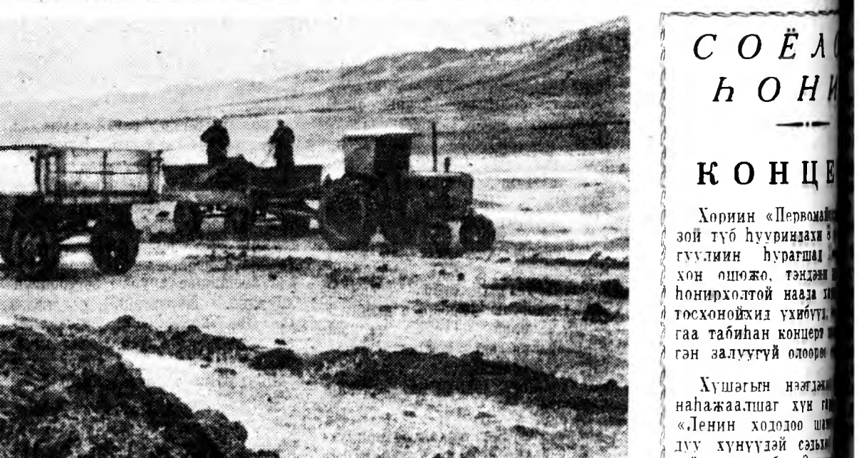
Хүдэрин совхозой 4-дхи отделени...