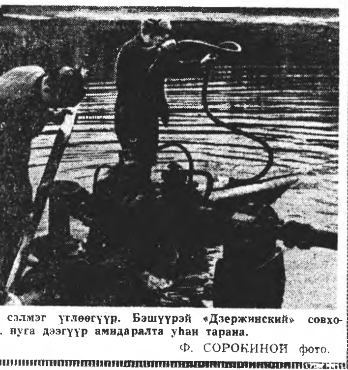
Хабарай сэлмэг үглөөгүүр. Бэшүүрэй «Дэргинский» совхозой сабшалаан, нуга дэгүүр амидаралта уһан тарана.

хожом гарахаб? Миния эбдэрлэн анзаһанын хойнолонгы хэнье хараад орхихо бэлэн, тинбэшье би, минин һэнхэл тингэжэ шада-хгүй гэжэ ханаад, Доржо тэрэгээ хоёрдо-хөө хахалхаа тракто-раа гэдэргэнь залгаа һэн... Зүүн зүгтөө тэнгэри толорон, үүр хираала-жа эхийбэ. Таряална Доржо Батусевай сэд-хэлдэ аятай байһан мэдэрэл түрэнэ, тоһон-дэ дарагдаһан тухэ-рэн улаан шарайн баараар сороохило, хаанаашыбэ бодол-дон эбхэрэн үгэнүүд сээжэ сооһоонь суура-тана; — Амар сайн, арбан гурбадахы таряаша ха-барин, амар сайн аруун үглөө, амар сайн, алдарта Май! Ц. ШАГИКОВ.