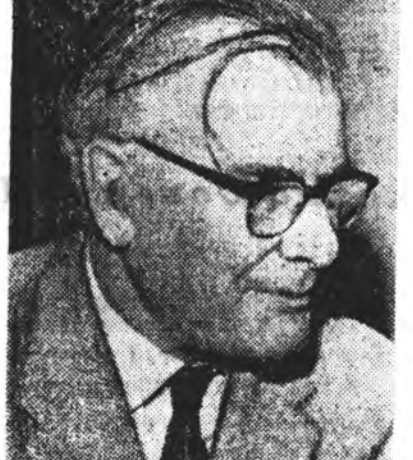
Гордон Шаффер Нинтын ажал ябуулагша (Англи)