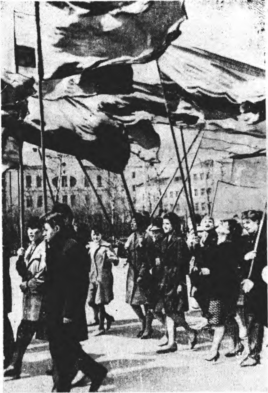
Залуу наһан Улаан талмай дээрэ мандала. Хабарай хэбшээн наа

Сэлмэс наранай элшэ томо гэшын часай 11 тоо харуулхан зурада дээрэ тудалдана. Нислэд хотымнай Советүүдэй талмай дээрэ хүргэ марш наяршаба. Хайндэрэй-хөөр, гоё хайханаар шэмэглэдэн гудамжа, талмайнуудые амиды шангеар долоон шээршөө. Бүхы дэлхэйн ажалшадай наанада нэгэдэглэйн уласхоорондын энэ ехэ хайндэртэ Улаан-Удын олон тоото хургуулинуудай хурагшад, ажалшад, алаа хаагшад, худалмэришад агуу партидаа, Эхэ орондоо үнэн сэгжэ байханаа, агуу Майда ажалай үндэр амжалта туйлаһанаа, агуу хайхан үрээдүй—коммунизм байгуулгада нангин хубитала оруулжа байханаа элидхэнэ ха юм. КПСС-эй ЦК-гай мартын Илэнумай түүхэтэ шийдхэбэринүүдээр зоригжолон манай республикын ажалшад энэ хабарай жагсаалые хүртэйгоор ахилба.