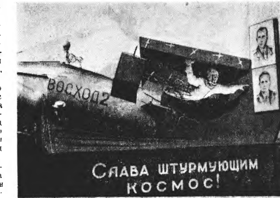
«Замбуулинаар алхалхан совет баатарта алдар соло!»

Олон предриятинуудай худалмаришад үгэрнэ. Ажалай амжалта туйланана алидхээн бэнэ. Улаан туг, плакадууд хубарина. Хирин-