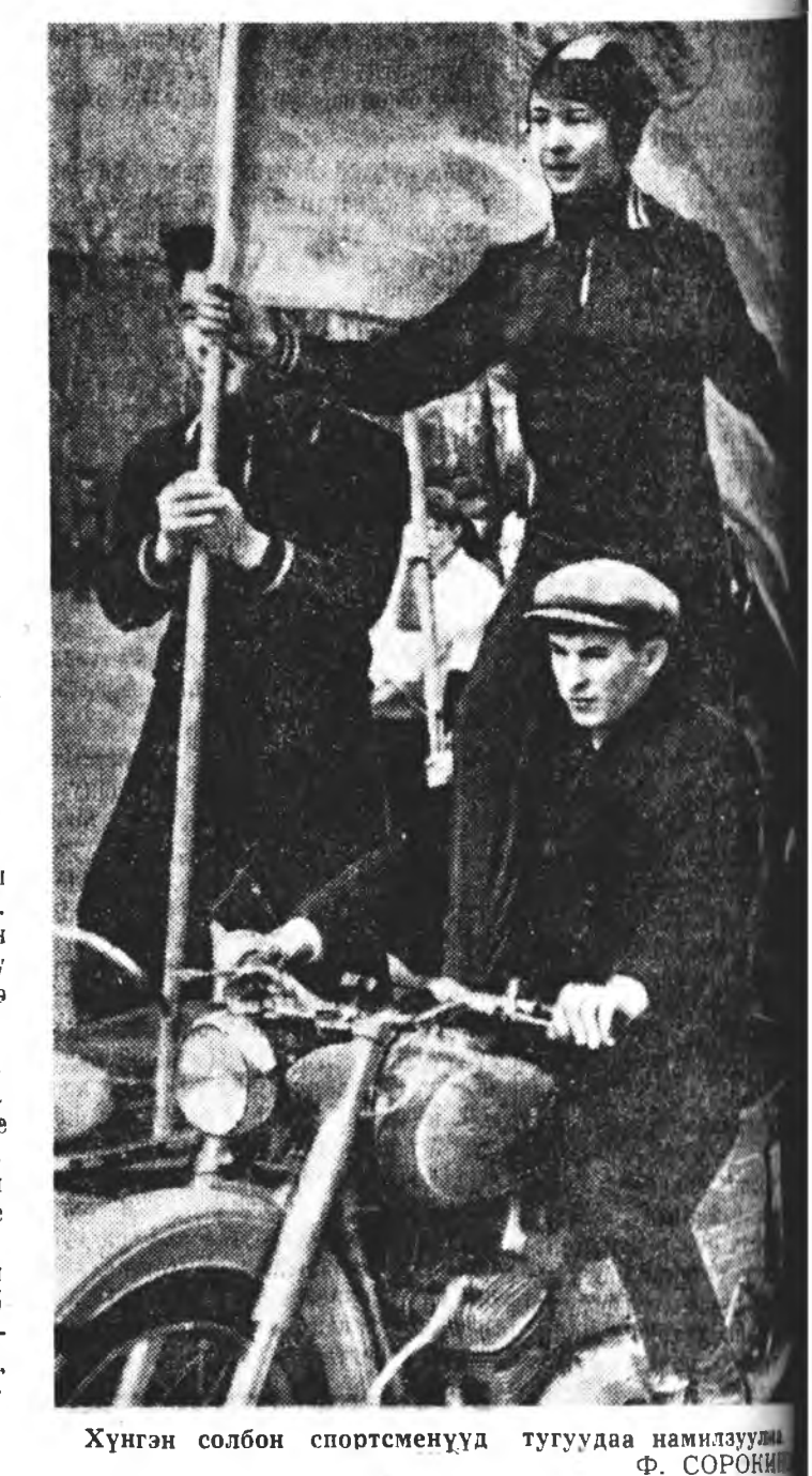
Хүнгэн солбон спортсменүүд тугуудаа намилзуун. Ф. СОРОКИНОН