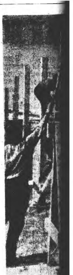
Мунөө жэл Хурагшад ажал хураахын тулд... Ф. СОРОКИН

«Алтанай сөнтэй үбэн» гэж аяр холын бусад аймагуудаа сааргалзан үбэн тухай Юрөгэй үгсэжүүлээд хөөрөлдөж байхынь нүүрэй хоёр-гурван жэлэй туршдаа нэгэнтэ баша туулаа нэм. Теад салгаа урган Юрөг голдо, уна ундаа байн Удэнгэ нутагтаа үбэн ногоон ургахаа болшоо юм гэж үнэншээр баша байгаа байл.