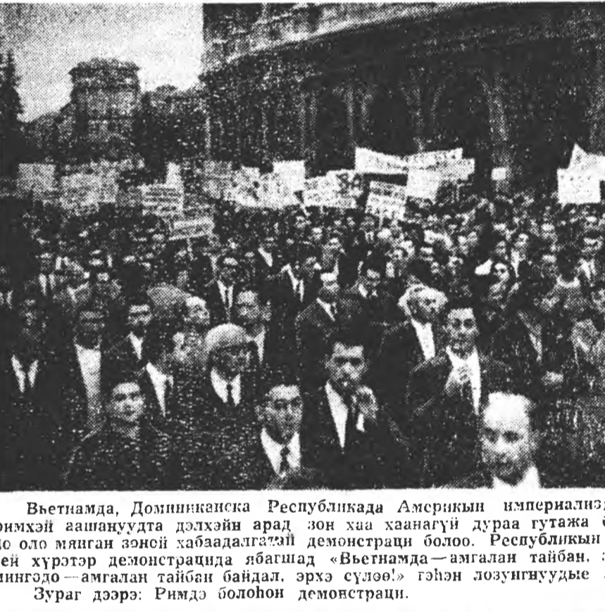
Вьетнама, Доминиканска Республиканы Америкын империализмын гаргажа байһан эзэрхэг түримхэй ажануудта дэлхэйн арад зон хиа хаанай дураа гутжажа байна...