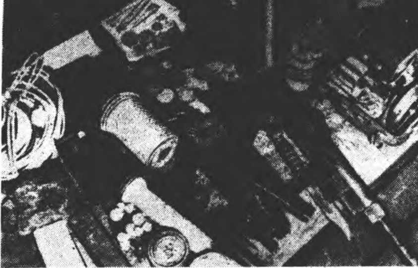
Американска ээрхэг туринхидшүүд ба тэдэнэй Сайгондохи да-хуулгуд ИРВ худар шинонууд ба һүйдхэлсэхэ ябуулна. ЗУРАГ ДЭЭРЭ: бүлэг шинонуудай абажа ябһан буу зэбсэгүүд ба хэрэгсэлүүд.

Мүнөөнэй Учредительскэ суглаанай түлөөдэгтэ хоёр жэлэй туршада хү-сэлтөө байха юм. Энэ үелэ оройной саг үргэлжин конституци эхлөбгөхө. Учредительскэ суглаандахи 173 һуурийн 85-ые «Аль-Умма» пар-тиянал депутатууд, 56 һурийн На-циональ-но-индоние партиинхид 11-ые коммунистууд эзэлэ.