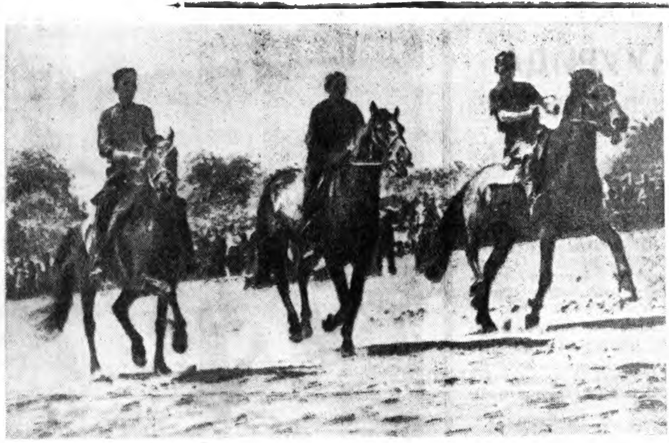
Кабанский аймаг ажахынуудта хатарша үүд тэрэй морид олоор үсхэбэрилдана. Унгарын ама- ралтын үдэр Колесово тосхондо хатарша моридой

МОЛДАВИН ХОЛОДИЛЬНИГУУД БИШИНЕВ. Молдавидахи өгээн түсүүшын тусхай холодильник барилга Бендерэд эхилээ. Энэ