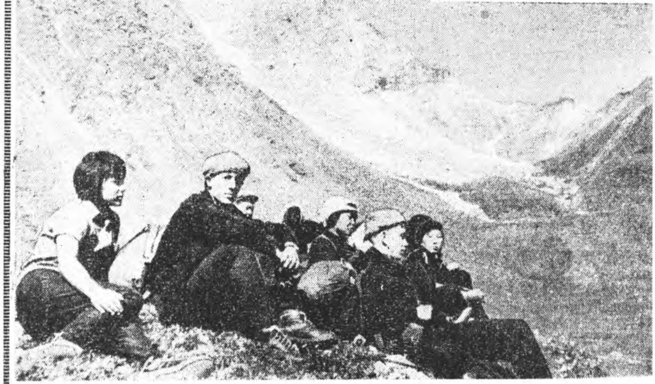
ЗУРАГ ДЭЭРЭ: Хэрэнэй дунда хургуулийн хурагшад Шумак хэдэн оройдо.

ЗУНАЙ аяма халуун үдэрүүд тогтожо, хүн бүхэн ээлжээ амаралтаа гарахаа түгээрнэ. Тэднээр хооло, ойгуур аяншалхаа аян замта бэлтгэнэ. Буряад оройнотгоо үзэхэд энэ гоё байгалийг Байгал далайн эрхээр аралд сулма ургалхан олон тоого аяншалгашдае харанан ээ байхат. Илалтаа эдэнэр-й дунда хургуулийн найнаай үхнүүд олон байдаг. Байгалийн гоё найхан газаруудтай танилсахын тула манай дуралханан турбан маршруттай нарые шалхуурагшай болхо. НЭГЭДЭХИ маршрут. Улаан-Удэ—Гремачинск—Турхэ—Горачинск—Баргажанай алаг—Хилхэмэ хушуу. Нимэ маршрутдаа яаха дуратайшууд ээ тосхонудта автобусаар ошожо болохо. Хилхэмэ хушуу руу ошонон аяншалгашад Байгал далайгаар тамаран энлэ хуржа шадаха. Угышые хаа, яагаар яабалгай, бүршье хаа байн. Юуг гэхэдэ, үзэхэдэн гоё газаруудтайнай илгэний эндэ юм. Далайн үхнүүдэд захар тубунынын загана-