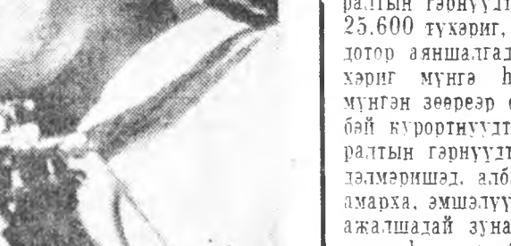
ИВЕРГЫТА ГАРААНАН ТУРУУШЫН ҮДЭР.

Совет гүрэмнай ажалшалай, гэдэнэй үри хүүгэдэй атуур мандын түлөө угаа ехэ анхарал оролдоло саг үргэлжэ таргажа байлжэ.