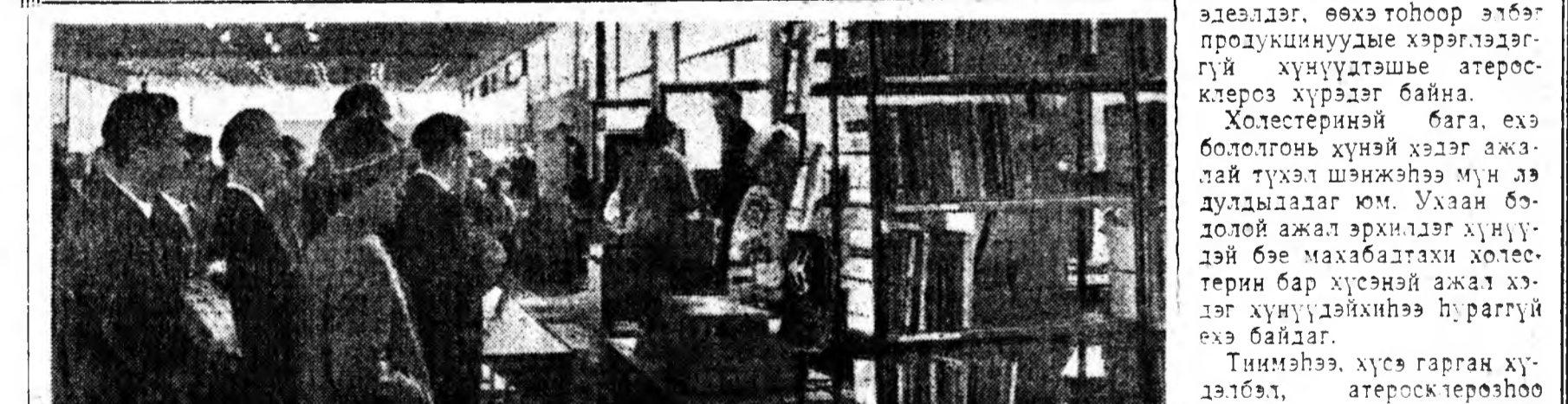
МОСКВА, СССР-эй ВДНХ-гай зэргэлдэ эмхидхэгдэнэ «Инфорга 65» гэжэ выставкэ.