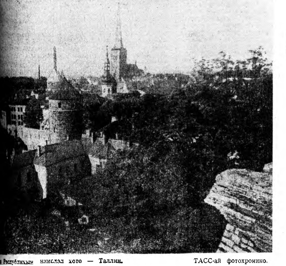
Таллин, Эстония Республикасынын виссел хото