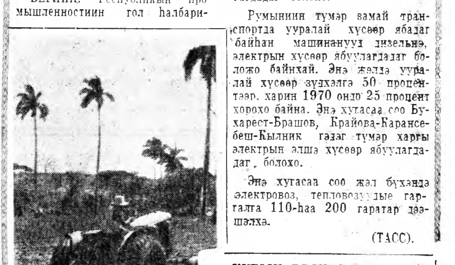
КУБЫН РЕСПУБЛИКА. «Эль Росарио» гэжэ арадай ажахы Пинар-дель-Рио гэжэ провинциин баруун талын хубида өшмөдөг юм. Энэ ажахы мүнөө 5.300 гектар газар эзэлдэг, түрүүшүншыншын зэрэгдэ абадаг юм. Зураг дээрэ: «Эль Росариогай» полнүмүд дээрэ.

ДИЗЕЛЬНЭ ЗҮДХЭЛГЭ НЭБТЭРҮҮЛЭГДЭНЭ БУХАРЕСТ. Августын 23-най нэрэмжэтэ Бухарестын завод 700 болон 350 мориной хүсэтэй теп-ловозууде бүтэн гаргажа элсэ-лээ. Түрүшүншыншын түмэр за-май станци, томо томо промыш-ленна предприти хангахаар хэг-дэнхэй, хоёрдохинь нарын мур-тэй харгы замда хүдэлгэ. Гарахаа байгаа табан жэлдэ 6500 мори-ной хүсэтэй электровозууд гар-гагдадаг болохо.