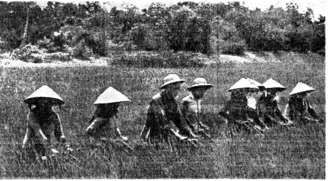
Ханойһоо 32 модоной газарта оршодог худөө ажакын «Нам Хонг» гэжэ кооператив Вьетнамай Демократическа Республикын түрүү ажакынуудай нэгэн байха. Эндэ жэлһээ жэлдэ рисэй ургаса ехэ һайн бейдаг. 1955 онойхино орходоо рисэй ургаса хөөр дахин дээршлээ.

Энэ үгэ хэлэһэн хүнүүд үгэ бүхэн Вьетнам-Шадудай аюулжа шүдэй үлеме болуул-гашаа дээрэ мүнөө бо-лоһо аямарар хан-дэ мэдүүдэ уялгатай