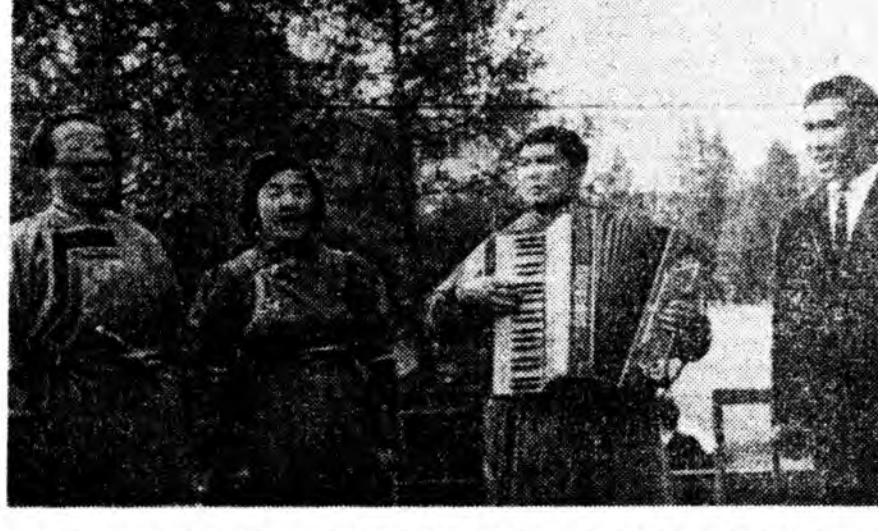
ОЙ СОО БУУГАЙ НҮРЭБЭЛ...

хур харбалгын найртай концерт харуулаа. Концерт харахаар 200-һаа дэһнэ мэлшад, һаллишал, хоншол, механикаторнууд тэр бүдөөрөө ерһэн, сэнгэлһэн байна.