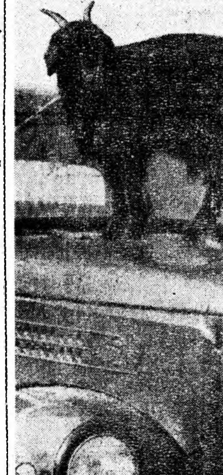
Эшэгэньше наа, мешинэда дуратай.

Мунөө үеин Алайрай буряадууд түрэн-нарый ухибуудтаа ехэнхилдэ ород нэрэнүүтэ үгэлэгэ зантай.