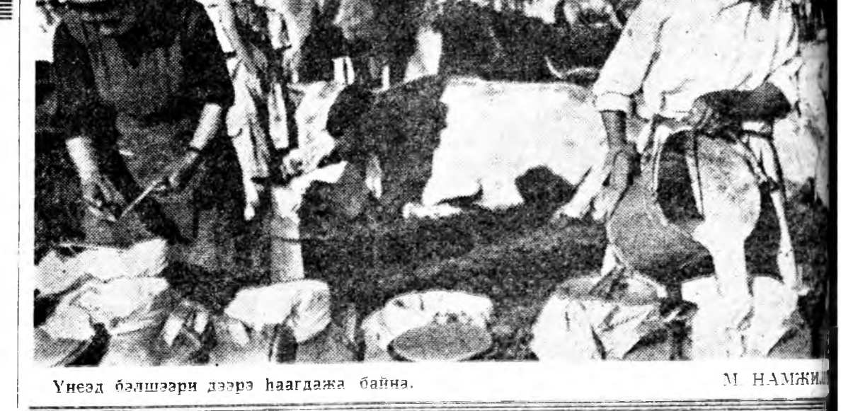
Унээд бэлшээрн дээрэ хаагдажа байна.