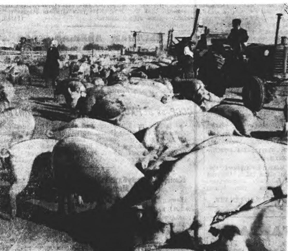
Совхозой ферма дээрэ шахалгада байһан гахайнуудта тэжээл үгтэжэ байна.

Цехүүдтэ амалын ямарнар эмхидхэгдэнб? Урдань нэгэ хүн 10—12 эхэ гахай, 1—2 азарга гахай даалгадгад байгаа. Мүнөө поршоохонхонудтай эхэ гахайнуудыне байлгадгад цехтэ