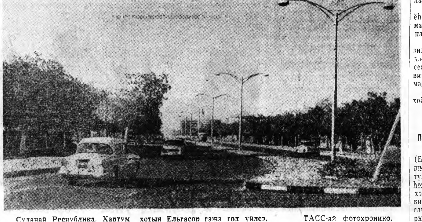
Суланий Республика. Хавтга хотын Ельгасоо гэжэ гол үйлсэ.

НЬЮ-ЙОРК, августын 18. (ТАСС). Сенатор Роберт Кеннеди интервьүү хэлхэдэ, «американска хуули гээшэ негр хүнэй дайсан юм» гэжэ мэдүүлб гээд «Нью-Йорк Геральд Трибюн» газетэ бөшөнэ. Энэ хуули хадаа хэээ бүхэндэ негр зондо эсэргүүгээр хэрэглэгдэнэ. Америкын сагаан шараата хүнүүд негр зон шанги тиймэ хүндэ эрхэ байдала байха болоо һаа, востани хэнгүй яаха һэй гэжэ сенатор хэлэб.