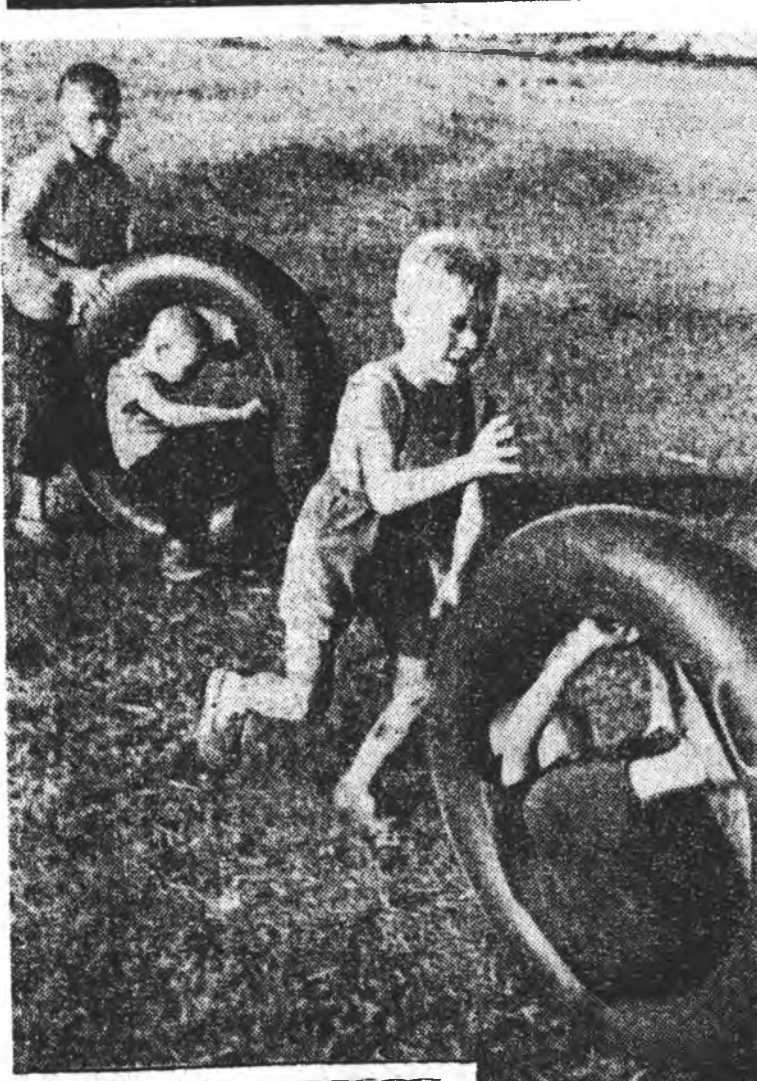
БҮРЯАД ҮНЭН. Эрэдүйн космонавтынуудай «ехэ лүреуулиа» 4-дхн юур. 1965 оной августын 21. Ф. СОРОКИНОЙ этюд.

Редакцида хандаһан хоёр нүхэдэй бэшэг ушнаһал, олон бодомжо түрэхөөр байна. Энээн соо хэлэгдэлэн баримтанууд хэмжэ хэтэрһэн ушар ааб даа. Энээн тушаа хуулин хэмжэ абаха юм бээ. Теэд тэрэньшэ гадуур, энэ бэшэгтэй авторууд нэгэ шуудла асуудал—аха нүхэдөө хүндэлдэг һайн һайхан ёһо заншал тухай асуудал табига байна. Энээн тухай би ханамжанууда бэшэб.