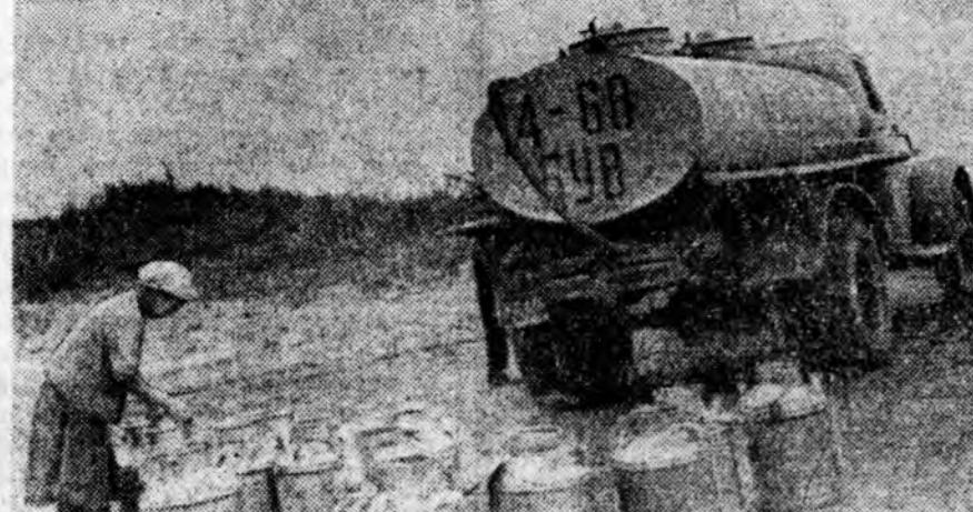
Хяатын аймагай «Дружба» колхозой Энхэ Талын һу һаалин фермын коллектив сагаан эдэе абаха долоон һарындаа тусэбэе үлүү-лэн дүүргэ. Һу һаалиһан улам бүри дээшлэнэ. Тингээ энэхэи һаалиһад һу абаха жэлэйгээ даабарин мэнэ ингээд дүүргэхэ бо-лоһхой. ЗУРАГ ДЭЭРЭ: һу шэрэдэг машина тус фермэ дээрэ эрээд байнэ.