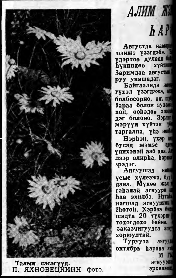
Талын сэгүүд.