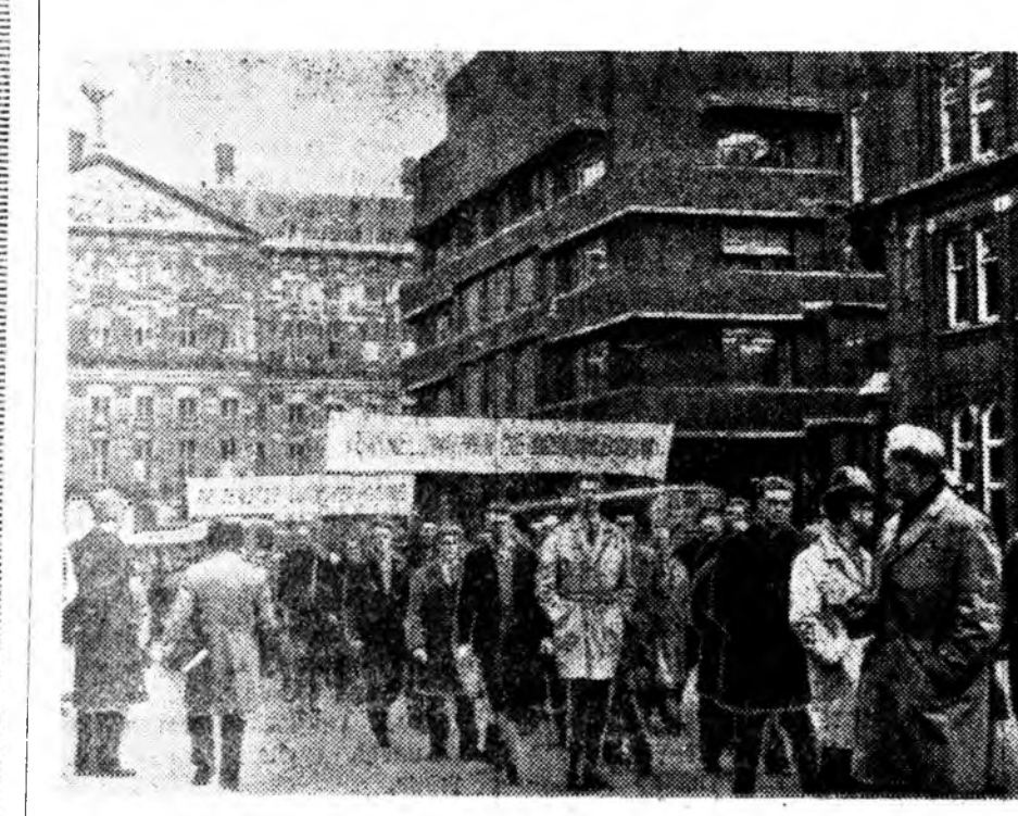
ГСЛЛАНДИ. Амстердам хотодо барилгын худалмэришэдэй эхэ мин тинг болоо. Гурба мянга гаран хүнэй хабалдаан олонон хотын гол үйлсөөр дабшаа ябана. Эдээр салин хүлгьен дээшлүүлэхэ эрилтэ хэнэ.