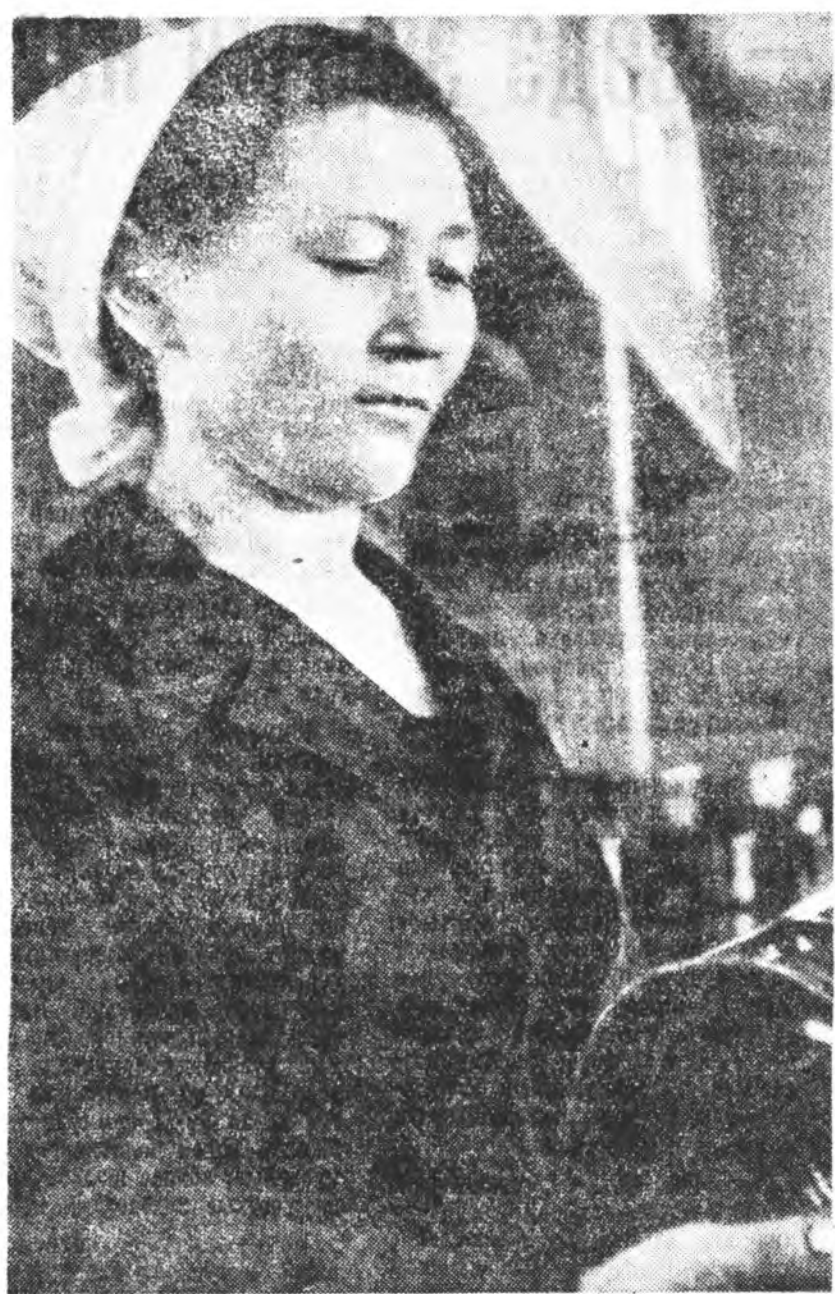
Улаан-Удын түмэр зүйлнүүд...