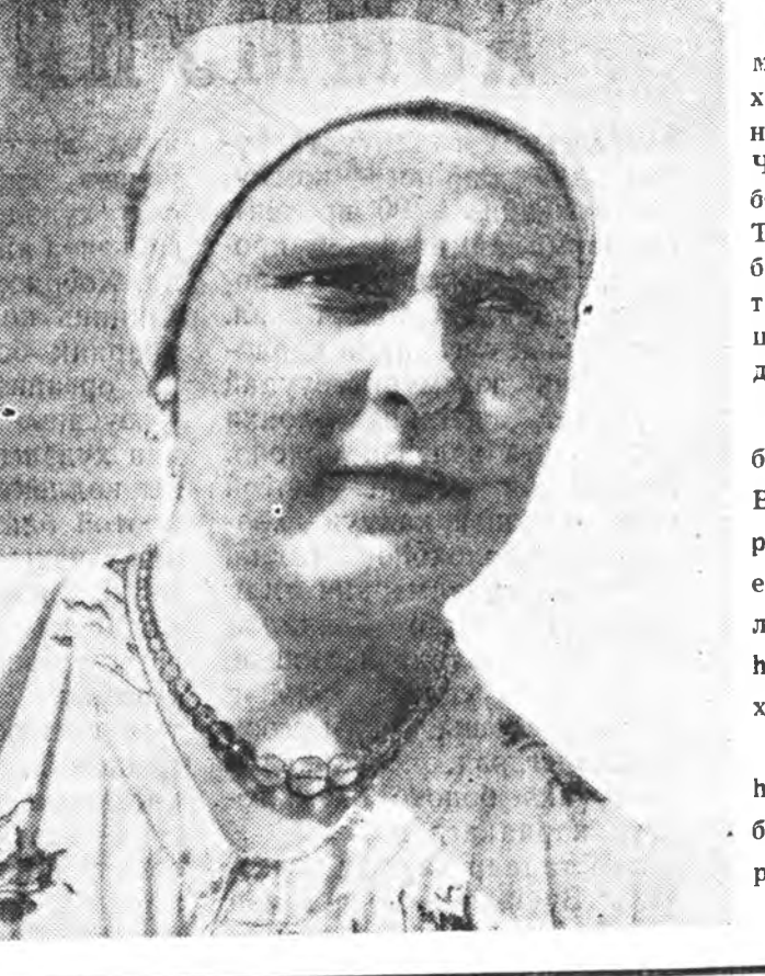
Мухар-Шабарна Ленин хоншон концентрат нэрэ Чимит Цыренбоек эрхим а Тэрэ харууны бүрнөө хурагтөнөөр түлээ шалха түс дүүргээ. Улаан-Үдэнэ ба колхозой Васса Иннеграева жэлдэ ехэ амжалтэй дэлий долоо бүрнэ харуула. ЗУРАГ Дээрэ түүрү боек, баалынграева.