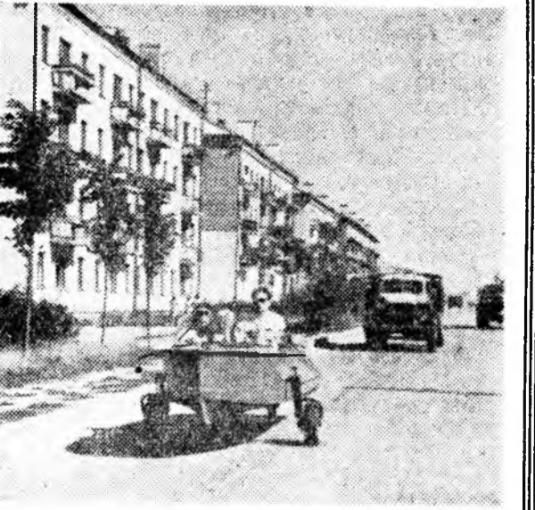
Чебоксара хотын үйлсэнуудтэ мөөртэй онгосонудан табила ябахан үе үе харагдадаг. Тимэ онгосонуд светфорой улаан галай хажууда зогсоод, удаа тэнье автомобильнуудай һүндлэһэн соо орожо, тэдэнтэй хамта даһшана, скоростингоһонь, арьссынгаһые талаар бусэдһаа дутаганы. Тингэһынь уһан соо орходоо ондооһоноор лэ ябадаг даа. «Амфибон» ээлд шөфөрөй ба мотоорто онгосын жолооһонтой эрхэтэй байха ёһотойн элгэ. ЗУРАГ ДЭЭРЭ: «Амфибон» онгосо Чебоксара хотын үйлсэнуудэй нэгэндэ.