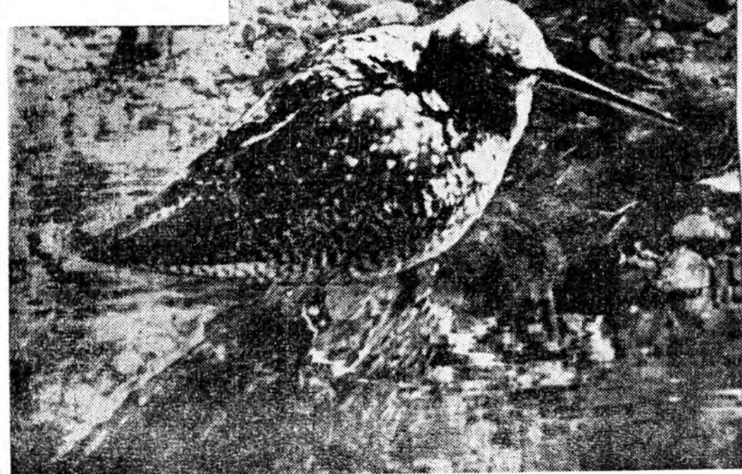
Ангуушад дүтлэе бүри обёрногүй.