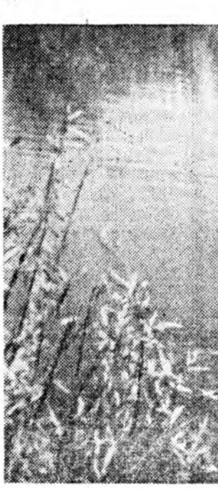
Олзогойхон лэ газар даа.