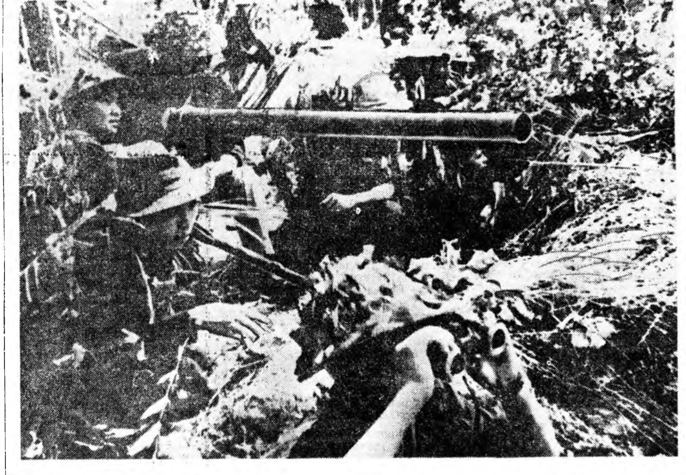
Урда Вьетнамаи сүлөөлөгшын арми байлдаан соогуур улам урган хатуужааг байнхай. Булган абахан ээбсэгүүдэй патриотууд дайснада эсэр гүү шанга сохилтонуудые хэ-нэ. Зураг дээрэ: патриотууд нууга соо хоргодонхой хууча. ВИА—АПН-эй фото.

Энэ һамбаандын, премьер болохо кандидат Эварист Кимба «олон хүн-дэй хабаалагатай, хүсэтэй правител-ство» амхидхон байгуулгыне тала-лар харилсаа холбоо хэблэе урла-жа, оройн бүхы политическа ажал абуулагшата мунөөдэр хандлаа. Конгын информационно агентствын корреспонденттай хөөрэлтэхэдэ Кимба нигэжэ мэдүүлэн байна.