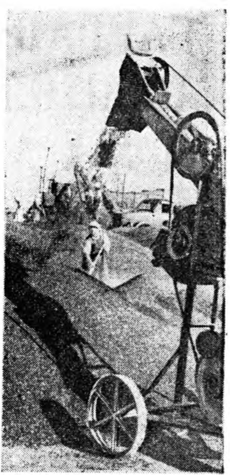
МОЛДАВИН ССР. Чадыр-Лунгска районой «Искра» колхоз мүнөө жэлдэ 1300 гаран гектар газарта наран сээг тариан байна. Эндэ гектар бүринөө 20 центнерхэ бага бэшэ үрхэ суглуулаха абана. Колхознигууд 1500 тонно наран сээг гүрэнд худалдаха гэжэ шиндхээ. Зураг дээрэ: оньһон оруулагдан тоог дээрэ наран сээг сээрлэжэ байна.