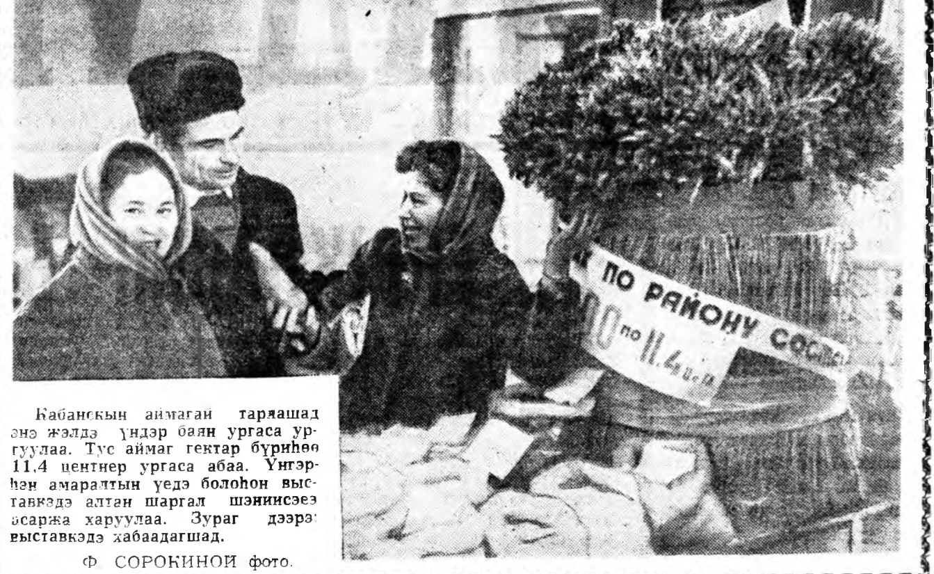
Кабанскын аньмаган таряашад энэ жэлдэ үндэр баян ургаса ургуулаа. Тус аньмаг гектар бүрийнө 11.4 центнер ургаса абаа.