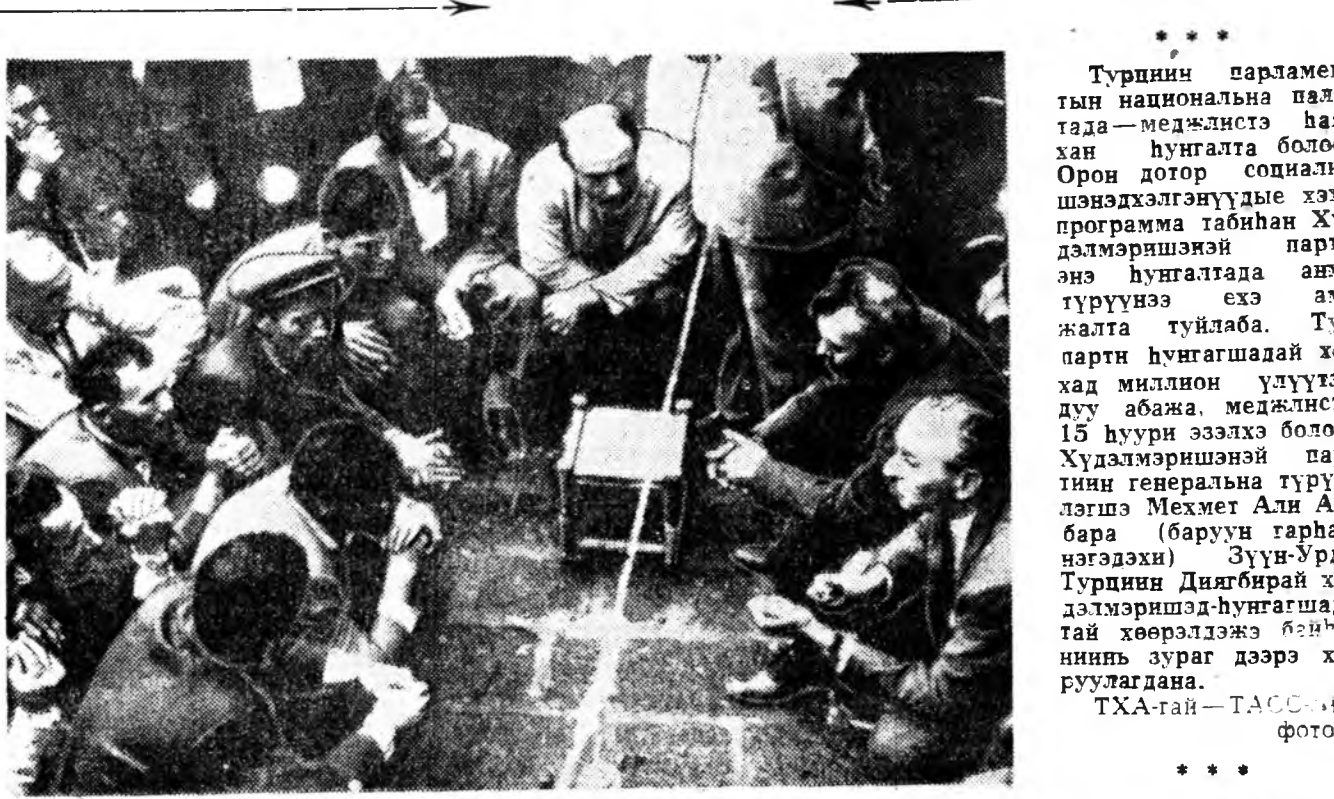
Турция парламентин национальна палатада—меджлисте һаяхан һунгалта болоо. Орон дотор социалист шэнэхэлдэлүүдые хээ программа табһан Хүдэлмэрилэгшэ парти энэ һунгалтада анха түрүүнээ эхэ амжалта туйлаба.

Политическэ шалтагаанаар хаалтада һуучшаные дары түргэнөөр сүлөөлхынь, бүхэ шарүүн шанга, доромжолото хуулинуудые болтуулхынь, африкынхидэй политическэ ажал ябуулгыне али болохоор хизаарлагдые зайсуулхынь 1961 оной расис конституциине болуулхынь, бүгдэ нийтэн һунгуулин эрхээ болон ёһотой бөөэ даанхай байдал бүри нааяр сонсохоо арга боломжодо үндэһэлэн, конституционно шэнэ хэмжээ ябуулгануудые хараалха зорилгоор бүхэ политическэ партинуудтай түлөөлэгшэдэй учирительнэй конференци дары зарлахынь революциин авторнууд Англида үшөө дахин дуралһаа. Иимэ хэмжээнууды бөөлүүлхыне Англи мүнөө хүрэтэр оролдотгой байһан юм.