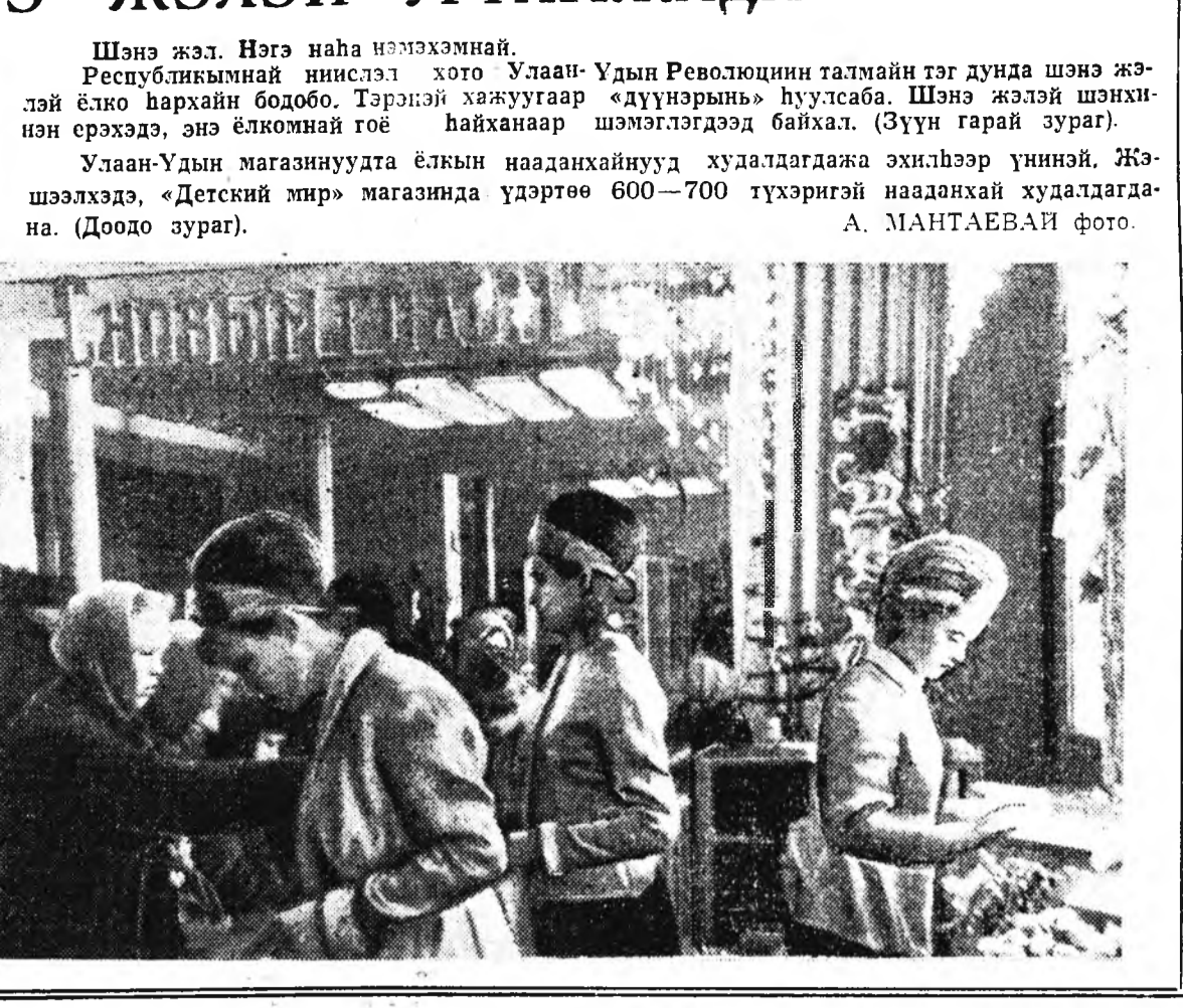
Шэнэ жэл. Нэгэ наһа нэмэхэмний. Республикынэй нислэл хото Улаан-Удын Революциин талмай тэг дунда шэнэ жэлэй ёлго хархайн бодобо. Тэрэнэй хажуугаар «дүүнэрын» хуулсаба. Шэнэ жэлэй шэнхэинэн эрхэдэ, энэ ёлкомнай гоё хайханаар шэмэглэгдэдэ байхал. (Зүүн гарай зураг).

Улаан-Удын магазинуудта ёлкын нааданхайнууд худалдагдажа эхилхээр үнийнэй. Жэшээхэдэ, «Детский мир» магазинда үдэртөө 600—700 түхэрэйгэй нааданхай худалдагдажа. (Доодо зураг).