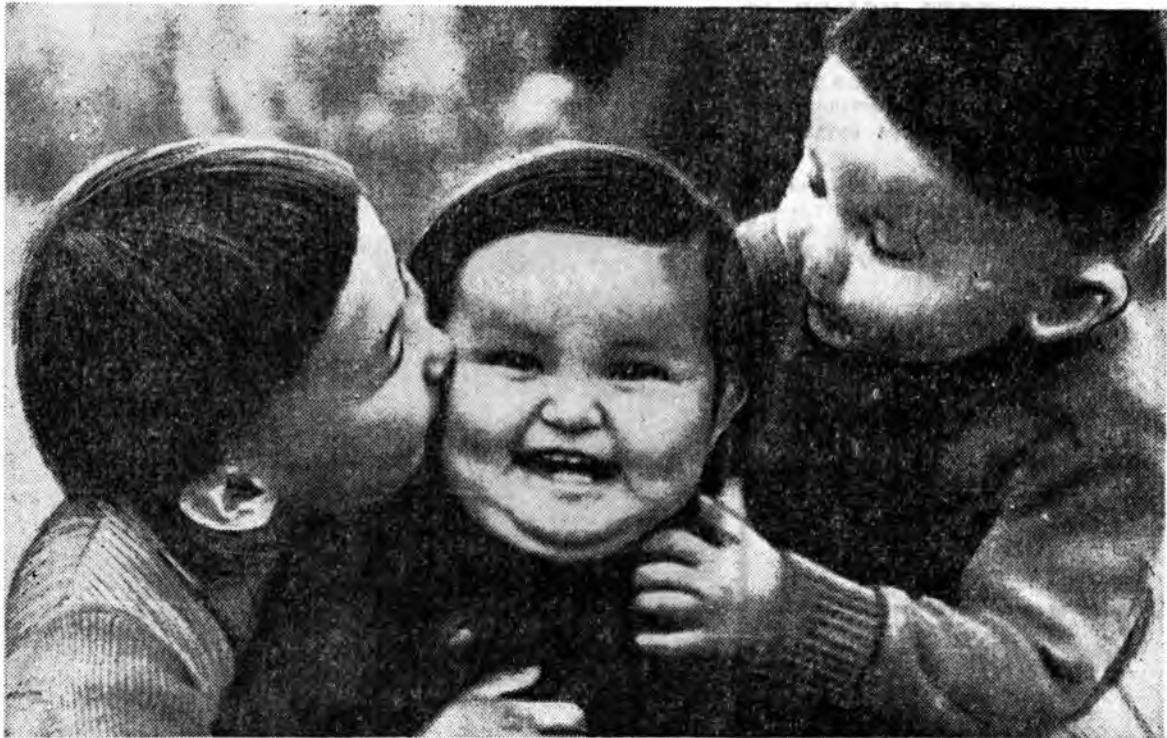
Хүүгэдэй яслида хүхүүтэй гээшнь аргагүй. Үлөөнхөө эхилдэг, үдэшэ бол- лотор хонгөө энээ- дэн, дуун, наадан.

Инмэ хүсэнэйнь нэрье Гини соонь уншагшаб. Агуу хүсэн бин юм даа: