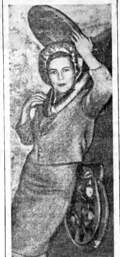
Энэтэй тайжа Эмеральда Рус-поль сууда гаранхай. Изагуртганаа үгэ гарбалтайдаа бэш, харич «поп-искусство» гэдээтэй түлөөлгөш байһан тулаада тингэжэ суур-каа. Энэ тайжа жорлон соогуур байдаг унгалзуудай хайжа эрүдэг ом ха «А-Би-Чи» журнал тээр зураг тунхаглаха зуура, Италиин чэээ промышленник гуша гаран тини «хөхдөлнүүднэ» абанхай гэжэ мэдэсэнэ.