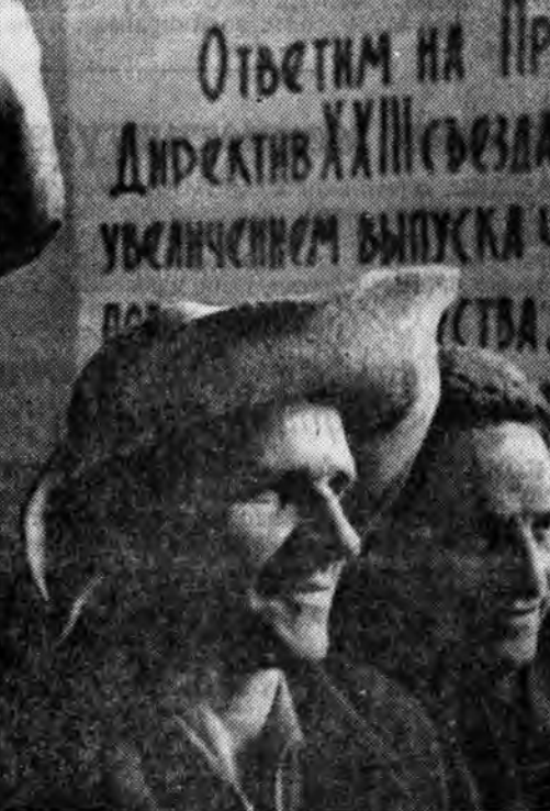
Кузнецкая металлческая комбинат лекция СССР-эй арадай ажыхыг хөгжөөхэ жэлэй түсэб КПСС-эй XIII съездийн Директивнүүдэй проектын гэгээтэ толлогдоһон дары Додоо Саянтин найман жэлэй хүрүгүнтин багша Т. Г. Вананина ойгууламжын хүдэлмэри ябуулаар өөрынгөө даана абанан Бахмит-стровой МТФ-эйн наалшадта оношо, партин энэ үгмэ ууда нашартай документе уншама эхилбэ.

«Коммунист ба тэрэнэй ажал хэрэг гэнэн конкурсо ороһон очеркнүүдһаа»