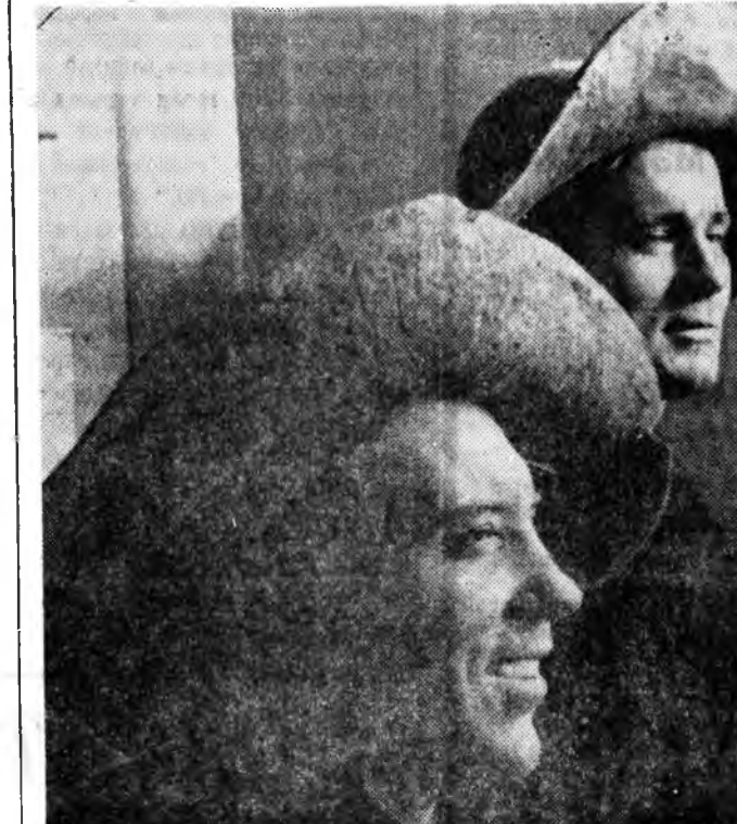
Ташие ямараар ханганбэ?