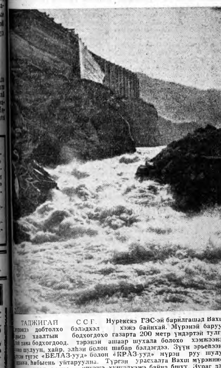
ТАДЖИГАН ССР. Нурекскэ ГЭС-эй барилгашад Вахш доторго добогдох бэлдэхэд хэжэ байхай. Мүрэнэй баруун талд хаалтын бодогдохо газарта 200 метр үндэртэй тулгаанан ашаар шуухала болохо хэмжээнэй модо шудун хайр элһэн болон шабар бэлдэгдээ. Зүүн эрьхээнэй талд тусгэ «БЕЛАЗ-ууд» болон «КРАЗ-ууд» мурэн руу шулуулаха, һабьне утарыулаха. Турган урхасалта Вахш мүрэнине шанда худэмэрине нигээжэ хүншодхэжэ байна бошуу. Зураг дээр Вахш мүрэнине шака тасарта.