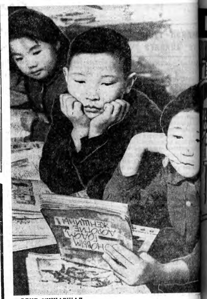
ЭДИР УНШАГШАД.

Александр Иванович Воейков манай сагай уларил шэнжэлэгшэдэй дунда хуульчтай, хурса ухаатай эрдэмтэнгэжэ тоологдоно. Олон жэлэй туршда шэнжэлэлгын ехэ хүдэлмэри хэжэ, оройлой географическа эрдэм шудалагшадта тунатай юмэ зохиёго үгэһэн байгаа. Эсэхэ сусыхае мэндгүй, холын аяшалагада гарагад Александр Иванович Урал, Кавказ, Дунда Ази, мүн хилын сагуур Хойто, Урда, Центральна Америка, Инди, Пейтон, Индонези, Япон хураһан намтагтай.