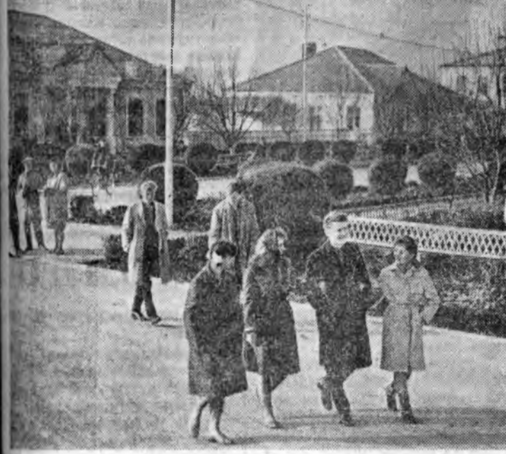
КРАСНОДАРАЙ ХИЗААР. Рис тарида «Красноармейский» цех совхозой олоо дохонды улам еха болно. Уналагдаг гар-мын еха ашаг олоо оруула: продукция гол фондын 100 тү-рүгэ бүхэн 300 түхүрэгэй ашаг олоо үгэнэ. Тэрэсэлэн пол-еудай, механизаторнуудай салин хүлээнхэ нэхэлсэнэ. Хүлээнхүүдэй ажалуудай, соёл болбосорол жэл бүри улам түрэлдэ.