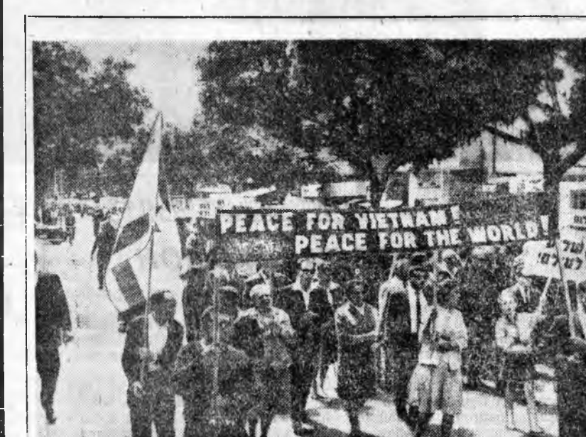
Вьетнама эсэргүү американска эзэрхэг турмжэй абуулыге буруушадан Израилин ажаншадай демонстрация Тель-Авивта болохоодо. «Вьетнамай хэрэгүүдтэ США-гай хамаардаг ябадла болуулаха».

НАТО-е хубилган эмхидхэхэ гэгэн Франциин эригтэ тугаа США-гай, Англиин, ФРГ-гай түлөөлөгшэдэй Бондо хөөрлэдөө хөжэ байһан тухай Англиин хэблэл мэдэсэбэ. Урда Вьетнамай нислэлдэ олоороо бунгажа хөгшдэ «Гатическа илалта» туйлаа гэжэ «Нью-Йорк Таймс» Сайншоно дамжуулан мэдэсэл дотороо тоононо. Эндээ сэрэгтэй хунта гурба-таба һарын үеэр һунгардаха граждн правительствда хуули засаг угхөөр найдуулаа. Теэд Нью-Йорк Геральд Трибунэй тэмдэглэһэнэй ёһоор, буддистнуудай зарим бүлэгүүд генерал Ки гэгшье, сэрэгтэй хунтын бусад гөршүүдые эн гэрһээр тугаалһаа гаргаха эригтэ табина. Гэхэтэй хамта «Хэрбээ эрээдүйн (граждан—Редакциин ажагалта) правительство генералуудые ханаагаагүй наа, унагаардаха байха» гэжэ мэдүүлһэн Сайгондохи мүнөөнэй премьер-министрэй үгэнүүдые Франциин «Фигаро», «Оро» газетүүд дурдана һунгалта хэблэди гэгһэн Сайгонэй засагаархидай найдууланг Урда Вьетнамадхи политическэ хөмөрөө ялабашы һуларуулаха шадхаагүй гээд Баруун Германиян «Франкфуртер Рундшау» тобишно.