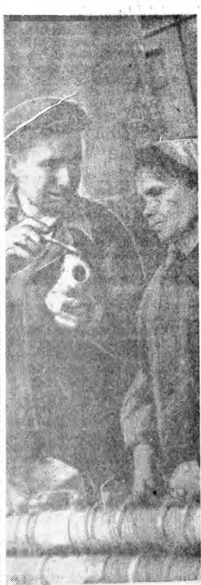
Табан жэлэй түсэбөөр