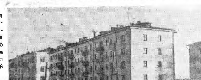
ЗУРАГ ДЭЭРЭ: Ербано-вай нэрэмжэтэ гудамжада-хай наа бодогдоһон ажануудалай шөнэ гэрнүүд.

Республикннай нислэл —Улаан-Удэ хотын 300 жэ-лэй ой тэмдэглэхэ үдэр ойр-толой байна. Манай түрэл нислэл хотомнай үдэрнөө үдэр бүри танигдахаар башэ болон, гоё хайхан, һаруул байшан, гэр байрануудтай боложол байлаг.