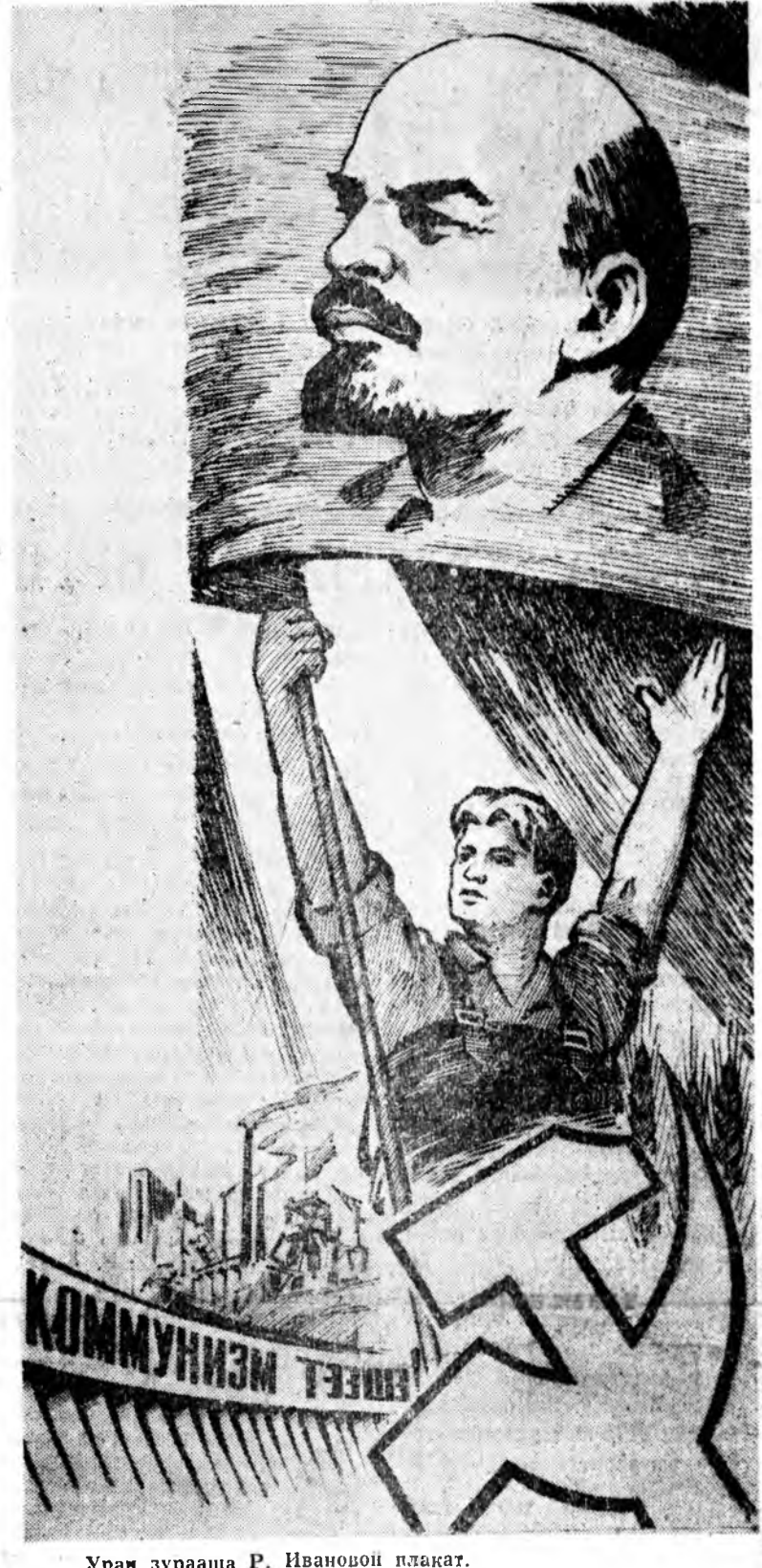
Ураг зурааша Р. Ивановой плакат.