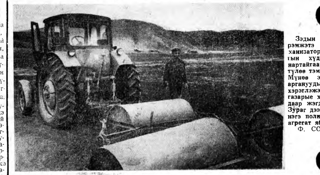
Зэдэн Ленинэй нэрэмжэтэ колхозой механизаторууд тарилгын хүдэлмэриг шаартайгаар үнэгэрхэн түлөө тэмсэжэ байха. Мүнөө энэхэд түрүү аргануудыг түргөөр хэрэглэжэ, тарилгын газары хүндэ катогудадар жэгдэлэн дарана. Зүгэ дээр: колхозой нэгэ полядэ тарилгын аргат ажаба байна.