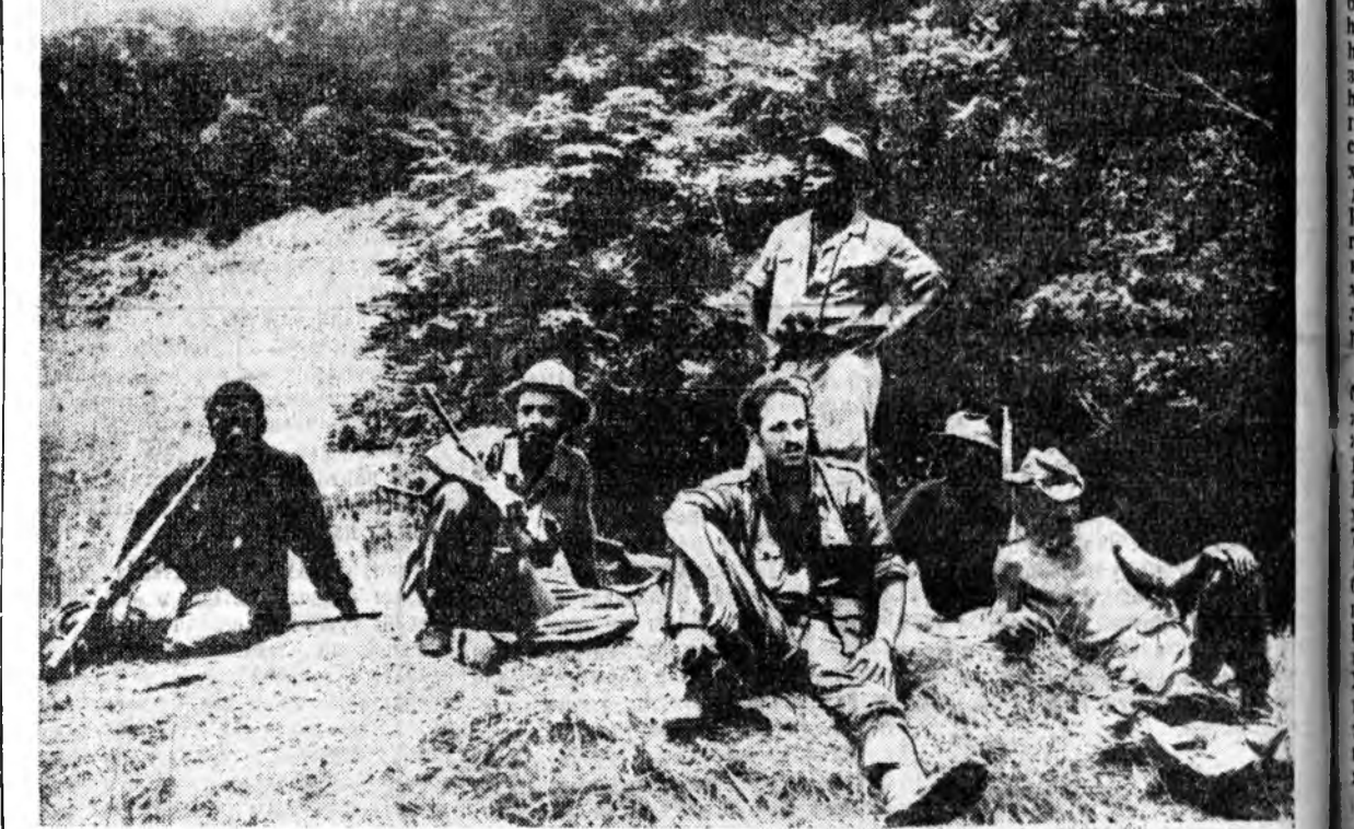
Португалин колонизаторнуудта эсэргүүгээр Англин арай адый зобсогт тэмсэл хэжэ эхилһээр табан жэл гүйсэхээ байна. 1961 ондо эхилһэн востанние Англие сүлөөлхын түлөө худалһын (НДОА), Англин хүн зоной союз (СНА) толгойлон юм. Агостинью Нето гэшын толгойлогд НДОА-гай парти оройногтой хүн зоной ханал хүсэлтэ бэлдүүлгэ, колонизаторнуудта эсэргүү тэмсэлэ буудалг бүхэ хүсэнүүды нэгдүүлхын ба «Эхэ ороноо эрхэ сүлөөтэй болгохын түлөө тэмсэл абуула.

Адрес Обьединенной Редакции: гор. Улан-Удэ, ул. Ленина, 35. Телефонны редактора — 23 67, зам. редактора — 38-42, зам. редактора — 35 84, секретариата — 27-37, отделов: сельскохозяйственный — 47 59, 35 14, промышленный — 48-89, 33-61, корректорская — 35-95.