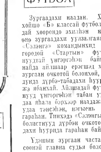
ЗУРАГ ДЭЭРЭ: улаан-удынхид айшадай воротагай дэргэдэ довтолгоо ялана.

Зургаадахы наалан. Халбарна хойшо «Б» классай футболистнуудай хоорондоо эхилэн нааданай энэ зургаадахы уулаалга манай «Сэлэнгэ» командынхид Ангарск гөрлөй «Стартин» футболистнуудтай үнгэргэһэн байна. Манайда айшаар ерэгшад мүнөөдөө зургаан очкотой болонхой, бусдайд дунда дүрбэ-таадахы нуури эзэлжэ ябанхай. Айшадай футболистнууд үнгэргэһэн табан уулаалгада ялала бэрхээр наадажа, дүрбэ удаа тэнсэһэн, нэгэнь шүүжэ гаралан. Тинхэдэ «Сэлэнгын» футболистнууд дүрбэн очкотой, арадахы нуурда гаралан байна. Уршын зургаан часта, мурисоной гавна судья боложо ерэн Н. Розов (Красноярск) наадаа эхилэнэ. Айшадай довтологшод нааданай эхилэн саргаа хойшо улаан-удынхидэй тала руу хэдэн удаа довтолгоо, хамгаалагшад Котельников, Гончаров, Бугарин гэшымдэ ялала мэдэхээнэ, тухашаруулна. Энэ жэлдэ өрхим хайнаар наадажа захадан айшадай улаан-удынхидтэ тинхэмдэ бэлээр шүүтлэжэ гүрхөөр бэшэ, шадмар бэрхээр наадажа, харагшадтай зүйнөө хайшаагдаа. Зүгөөр «Сэлэнгэ» бүтэглэй футболистнууд, илангаа ворота хамгаалагшад, баһал шадмар наадажа, айшадагшад тоо нэгэлгэнгүй. Нааданай түрүүшын хахалт алинь командын футболистнууд тоо нэгшэ шадангүй, амаралтаа гарана. Улаан-удынхидэй командада