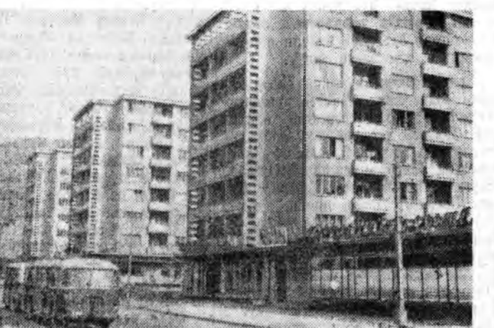
Белградтин Арадай Республика. Зураг дээрэ: Сливен город-тедхи байсын шэнэ гэрнүүд. 1966 ондо орон дотор 1 миллион 325 мянган дүрбэлжэн метр талмайтай гэр байра баригдаха юм.