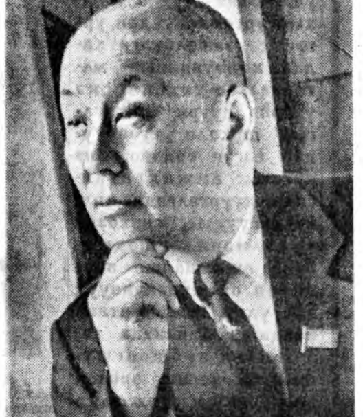
өөрингөө зөөрөөр шэнэ байһан барһан гү, али хуушанаа нэлбэхэе табиһан.

Гол үйлсэ уруун манган ехэ, сагаан шулуун хургуулиһа эхилээд, Советой байһангаа саа- ша, шинэ шинэ гөрүүд тэрхылдэхэ. Һүүлэй хэ- дхын жэлдэ зуу гаран гэр колхозой мүнгөөр баригдаа, тинхэдэ гурбан айл бүхэнэй нэгэнинь.