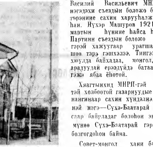
Совет-монгол хани барисаан жэл бүхэндэ бэхинжэнэ.