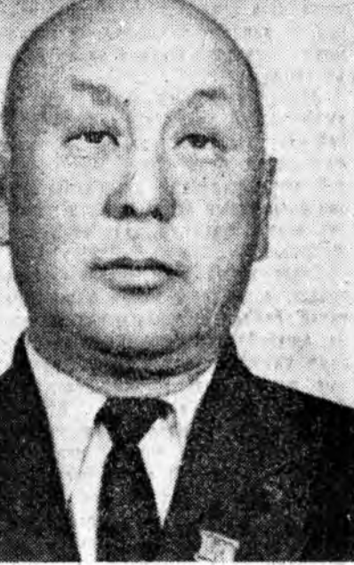
Михаил Алексеевич ЯСНОВ— РСФСР-эй Министруудай Советэй Түрүүлгын нэгдэхэ орлогшо, На- циональностойчуудай Советтэ РСФСР-һээ хунгаха Эрхүүгэй 10-даху хунгуулин округууно хунгадана.