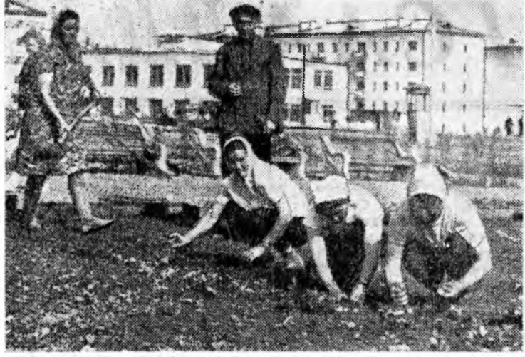
Улаан-Удын горьелэхой коллективэй худэлмэрилгэлд түрэл нинслал хотынгоо 300 жэлэй ойдо зориулан, 3.000.000 багша сэтгэ ажалладаг баруулань. ЗУРАГУУД ДЭЭРЭ: «Дружба» гэж нэрэтэй парк болохо газарта (Удын урда тээ) сэтгүүд хуулагдажа байна.