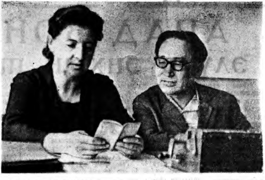
Партийна хуралсалал жэлий дүнгүүднээ