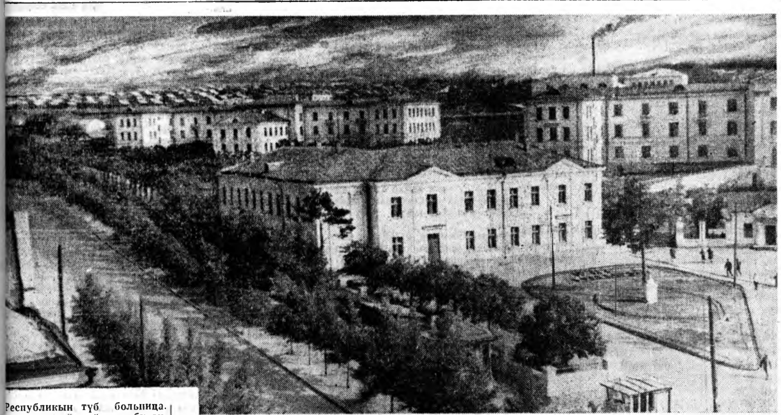
Республикын түб болында ярад ороонимнай зүг бүхэм хүнүүд эржэ, эндэ арга лана. Болынын коллектив а ехэ. Хэды олон табаг, та ватори, кабинетүүд бин гэ эй Зурга дээрэ хүн зоний түр эхмэе хамгаалдаг гулам хүүдэй нэгэн болохо респу бликскэ болынын гэрүүд буулагдана.