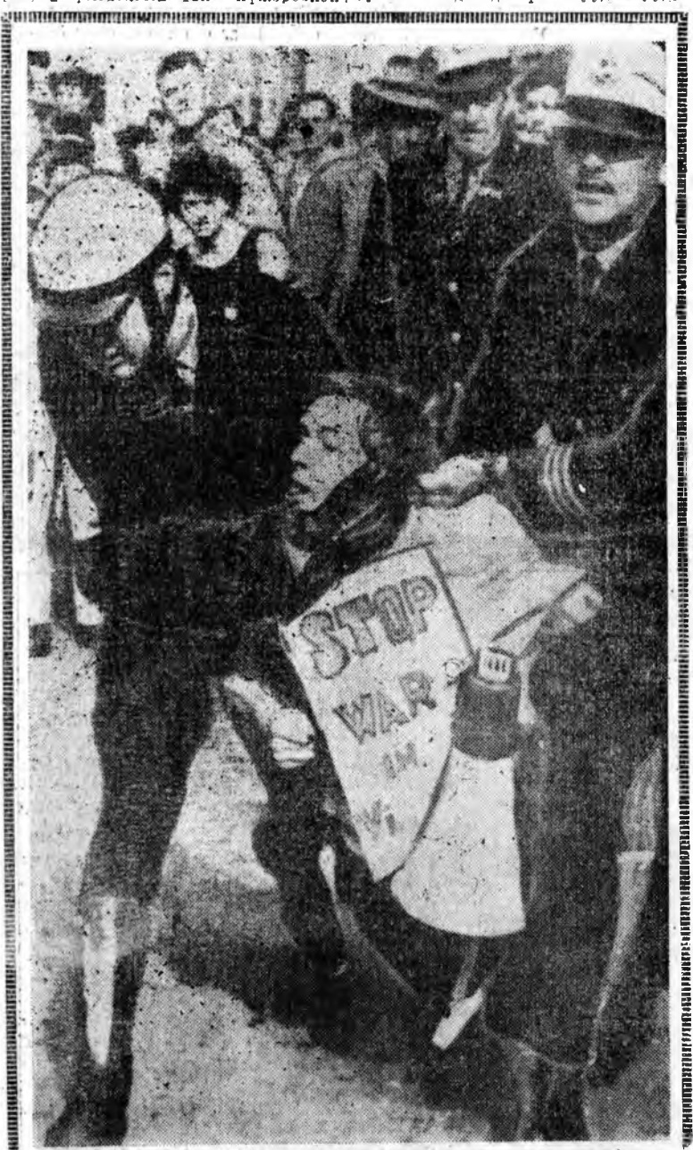
АВСТРАЛИ. Вьетнам ардагт эсэргүүтээр США-гай хүжэрөөһэн эсэргүүтэ муухай эзэрхэг түрмхий аюуллага Австрали хабаалсагһы бурхуушаань демонстраци баруун зүрхын Перт горото болоо.

Советскэ Союзда фашист Германия довтолгоон — Гитлеровскэ эзэрхэг түрмхий аюултын бурхталгын болон нацист рейхэй уналтын эхн табига үгэһэн довтолгоон 25 жэлэй ойтой дашарамдуулан, эдэ үдэрүүдтэ гүрүн хургал тухай болонжолоо үзэлдөө, харин олон биеэжэлэгшэ зүб тобиолол хэнэ: эб найрамдал хамгаалха, Европодохи аюулгүй байдал хангах гэшэ Европаны нийтын амаршы байгуулататай эхэ ба бага бүхэ гүрэнүүдэй хамтын зорилго болоно гэнэн зүб тобиолол хэнэ.