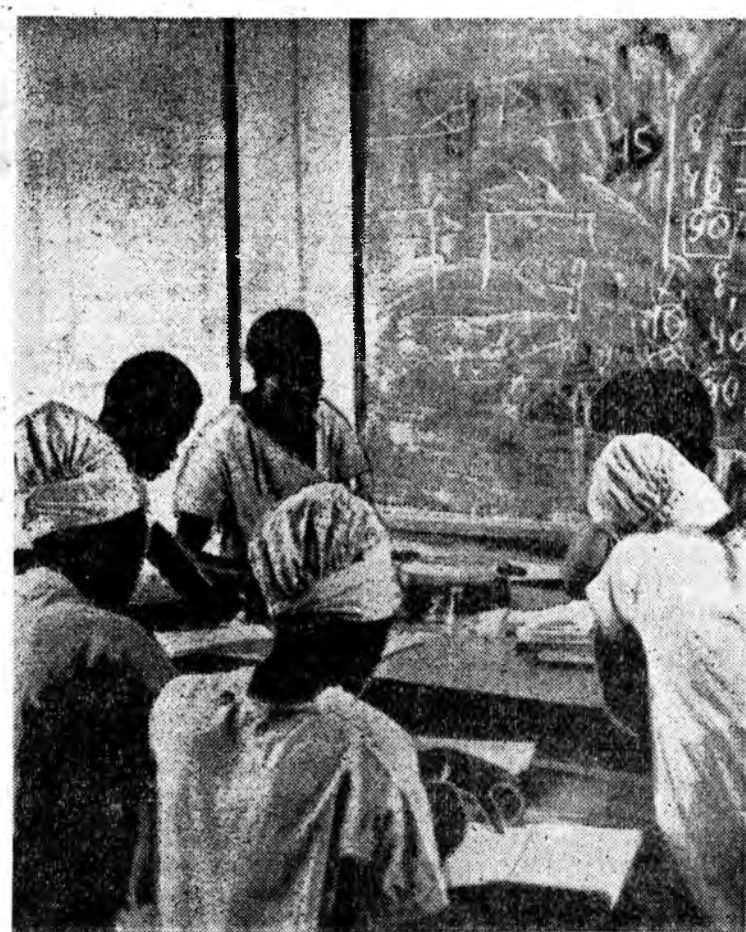
Малини ард үнэн сэхэ ханимарайнгаа туһаламжар хэтэ үеингөө гэгдэлһээ гаргаж байһай. Орон дотор хургуулинууд, профессионально-техническэ училищинууд нээгдэнэ.

Харин зарим шэнжэлэгшэ Советскэ Союзай болон Франциин хоорондох мүнөөнэй хэлсэнүүдэй умарлар дүүрхэ байһан тухай үйлдэлгэн таамаглална.