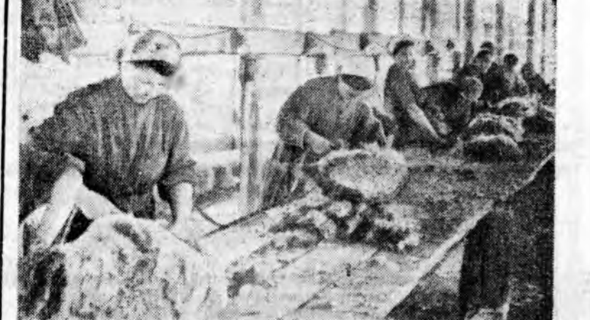
Францин Президентын Советснэ Союзда байһан тухай

ТАШКЕНТ. июнини 29. (ТАСС). 24 үдэрэй турша сөө намдуушар байһанай (хусенинх 4 балла дээш гарадаггүй бай-гаа) һуулар, Узбекистанай ние-лэлей түбэй хубида элчиртиргэ гажар торхон хүсэнай халаад орьбэлье Ташкент гэжэ сей-симческэ станиц мунгар тэм-дэлгэе. Нотагай сагаар 13 час 15 минутда таба-зургаан балл хүсэтэйгоор хоёр удаа газар дор-бөө, нэгэ час дунд минутын үн-дэрнай һуулар долоон балд хүсэтэй дорбөөн дахад болоо. Энэ хада мунөө жэлдэй апрелини 26-да болжэ торхот хониндо хуаруудан газар худэлмэрин