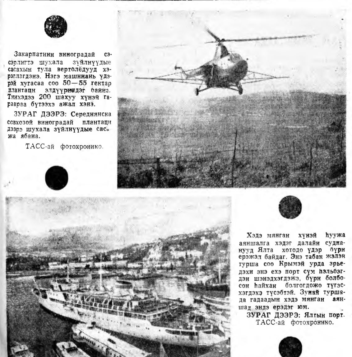
Закарпатин виноградай эсэрдигтэ шухлаа зүйлнүүдэ сасахын тула вертолэдууд хэрэглэгдэнэ. Нэгэ машинань үдэр хугасаа соо 50—55 гектар плантаци элдүүрнэдэг байна. Тинхэдээ 200 шахуу хүнэй таарараа бүтээхэ ажал хэнэ.