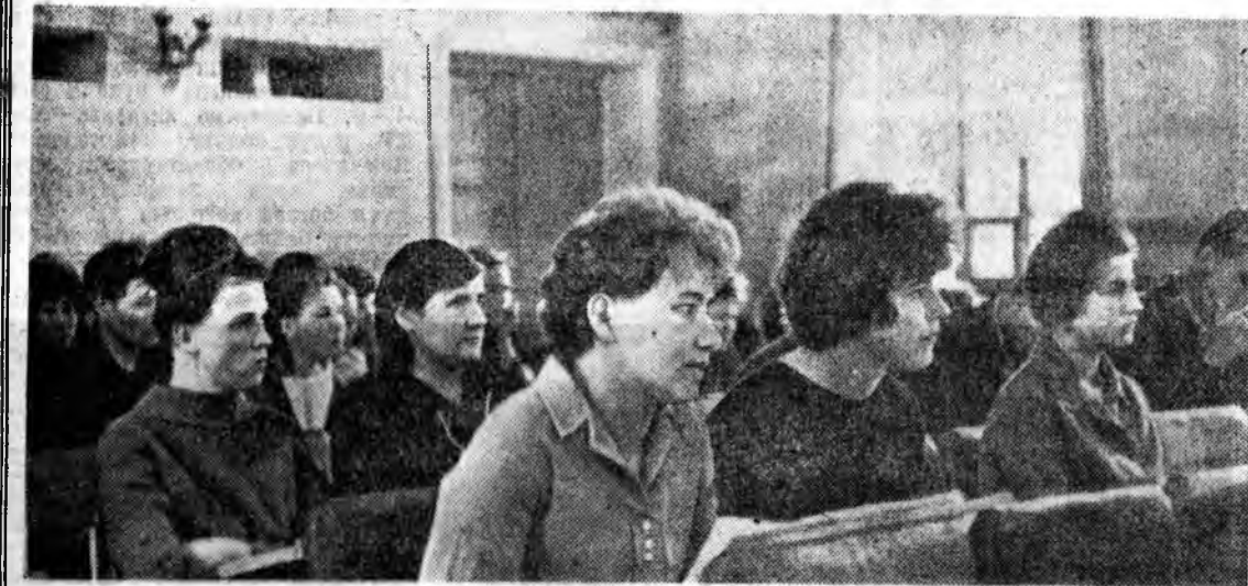
Зүүн-Сибирин болон Алас-Дурна зүгэй нүүдэл автоклубуудай хүтэлбэрлэгшэдэй семинар-зүблөөнэй засаданин зал соо.