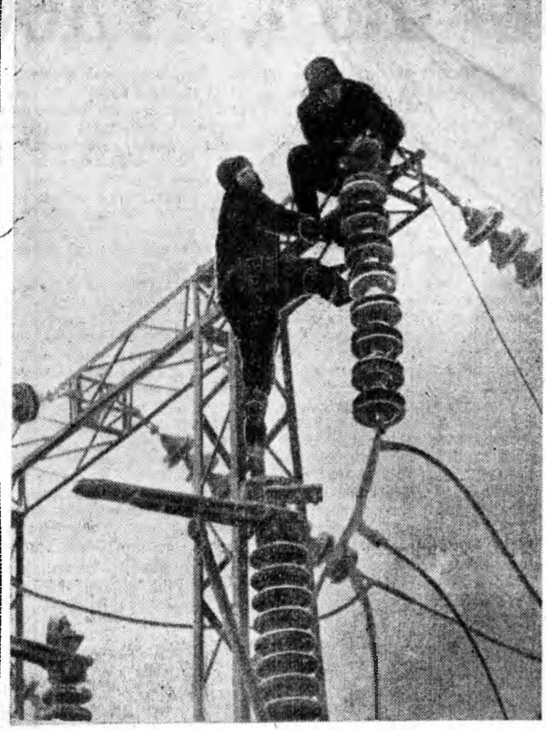
Ундэртэ дуратайбди.

ЗУУН СИБИРЬТЭ сагай ула-рил тогууригуй, аадар бороо оролгойтой байха. Гурбадхи декадын тэн багаар нэрюн — 5,9. Яхад болон Шэтын областдо — 2—7 градус болохо. Зарим газартэ хюруу унаха. Нарын түрүүшын ха-хадта гол түлөө халуун болохо, удэртөө 29—34 градус болохо. АЛАС-ДУРНА ЗҮГЭЙ сагай уларил хун зонийн урмыг таһа-руулаха — бороотой нэрюн байха. Нэгдэхэ декадада хүннин сагта 4—9, Приморско хизаарта — 12—17 градус болохо, Магаданска. Камчатска областнуудта хюруу унаха. Харин нэгдэхэ декадын хуулур багаар хоёрдох декада соо халуун байжа, удэртөө 27—32 градус болохо.