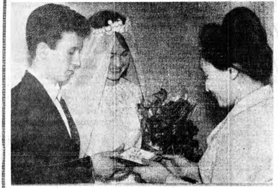
«Амаршалаа шэнэ бүлье»

БҮРЯАД ҮНЭН 4 дэх иүүр, 1966 оной июлинь 8.