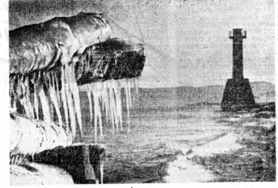
Байгал дээрхи маяк.