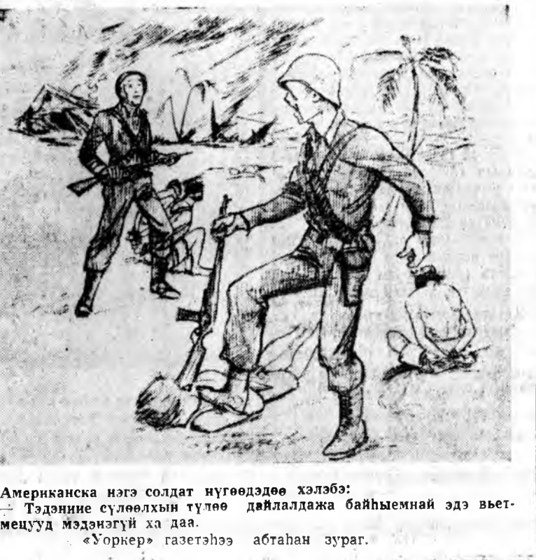
Американска нэгэ солдат нүгөөдөө хэлэбэ: «Тэдэни сүлөөлхын түлөө дайлагдажа байһыемнай эдэ вьетнамецууд мэдэнгүй ха даа. «Уорнер» газетһээ абһан узраг.

асуудалаар асуулта эмхидхэхэм гэжэ сонсохоо. Лондондо һаяхан багалаһан конституциин үндөөр Басутоленд 1966 оной октябрийн 4-һөө хойшо бэээ даалаг болохо юм. дэлхэйн энэ нутагта амгалан тайбан байдал һэртгээлэ зорилготой хэлсэ хэжэ эхилэ арга боломжоншудай нэгэн болохо һан гэбэ. Тинмэ ушарһаа, «Зүүн-Урда Азида хабаагүй орон нутагуудһаа үдхэгдэн бөлүүлагдажэ байгаа энэ даие доро хохилоттой дайн гэжэ Франциин Республика тоолоно»,—гэбэ. базаанууд болоһон Таиландын правительствэ бэээ даанги Камбоджодо эсэргүү ээрхэг түрмхэйл, хорото хархис ябуулануудые хэв. Таиландын солдадууд хүршэ оройнойгоо хилы ходо абһан, хилын харуушалта, амгалан тосхонудта довтолодог, мунуудые зобог, поли юрээ худалдажэ байһан тараашалые буудалга байна.