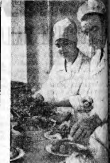
Запорожин «Днепр» гэж...