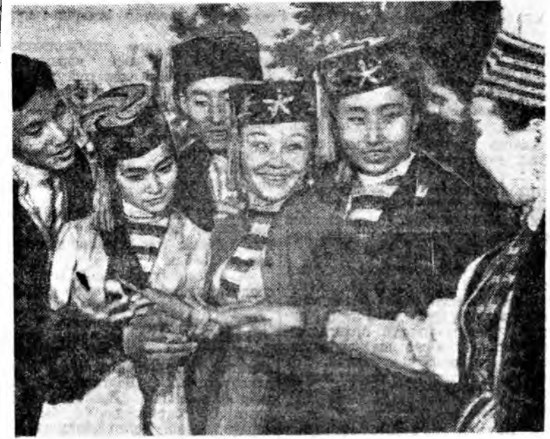
Хальмагай АССР-ий «Тольпан» гэж дуу, хатарай ансамбль республиканын колхоз, совхозуудаар аятамжа, уран бэлгээр зохино гайхуула. Илангаа хальмаг аятаар хонирхолтой, малт эхэтэй. Зураг дээр: хальмаг артистууд зоной бэлэг хаража байна.

Манай Совет бүхэн культурын ажлаудад асуудалын шалтгааныг гална, ажлын, хөдөлгөөний хэрэгтэй тушаагаа үргэлж хангуулах, зохино ажлаудыг абажа байх үүргийг хүлээн авч манай сельский хариуцаж «Искра», Лениний үндэстэй колхозуудыг ажаахын хариуцаж алаадаггүй, тэднийг болон уялгануудыг амьтгайгаар бэлдүүлж хэрэгтэй тушаалаа үзүүлэх хойноо арга боломжтой асуудлыг. Тиймдээ ажаахын үйлдвэрийн үйлдвэр сөлийсөдийг болон үйлдвэрлэлийн засаглалын дээр байх амьтгайгаар хаража уаадаггүй, манайн шийдвэрээр болон дүүргэхин тула манай сэтгэл бүхэн комиссиуд, депутатууд, дүүрэг ажаахын мэргэжлээр төсвийн олонд хун зон эмчлэх худалдманд эдэвхийлгээр болно.