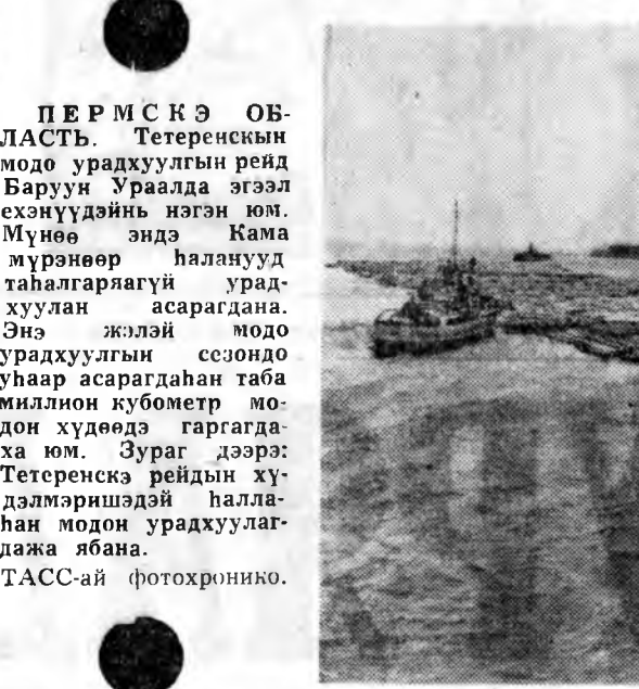
ПЕРМСКЭ ОБЛАСТЬ. Тетеренский модо урадхуулгын...