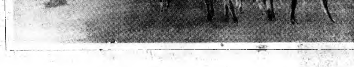
Угөөгүүр Саяан уулын хормойдо...

Хэрэглэмээр зүбшэл НАШАТЫРНА СПИРТЭЭР... али резинөө шэктоор үрэхэ.