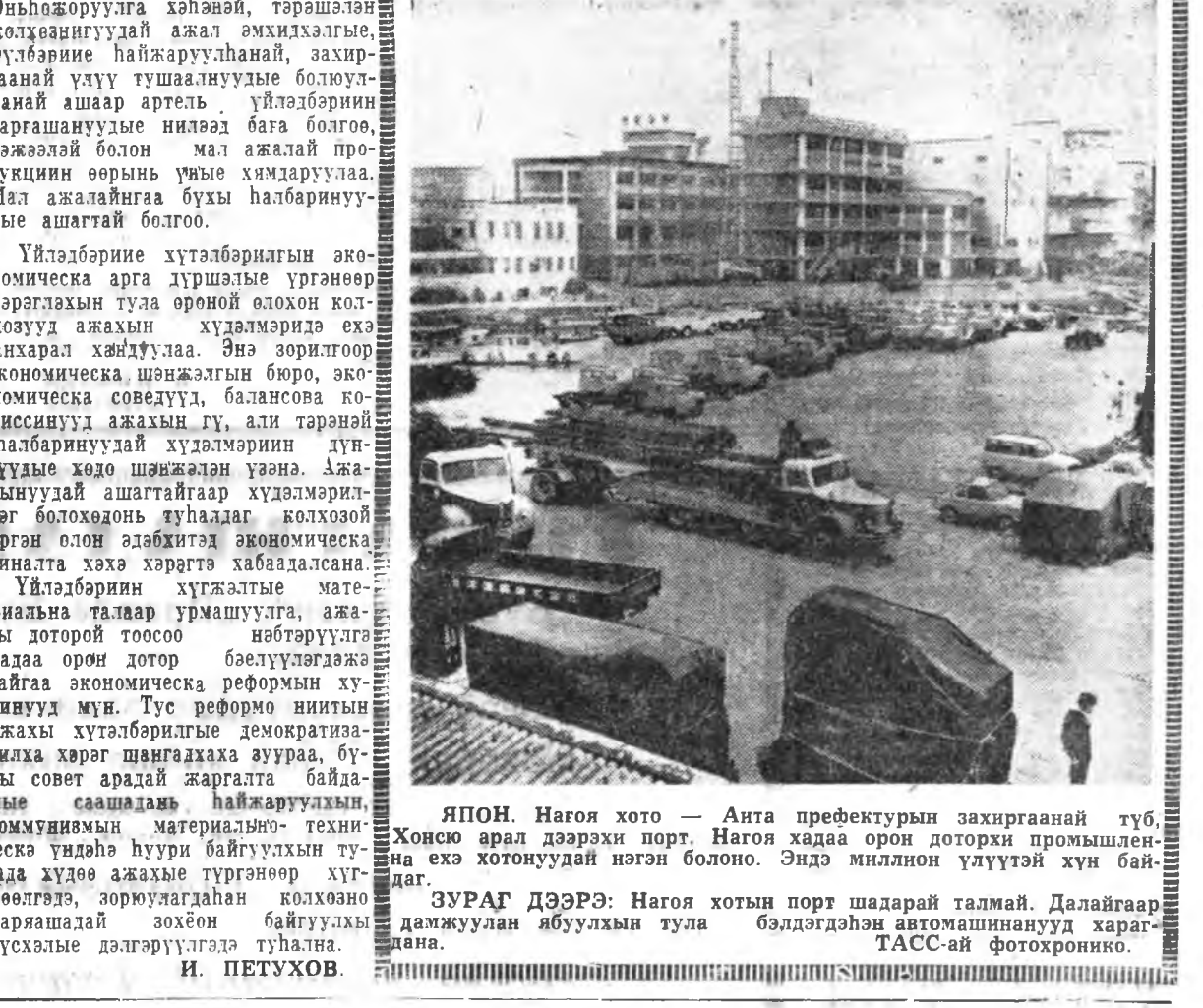
ЯПОН. Нагоя хото — Анта префектурын захиргаанай түб, Хонсю арал дээрхи порт. Нагоя хадаа орон доторхи промышленна ехэ хотонуудай нэгэн болоно. Эндэ миллион үлүүтэй хүн байдаг.

III. Үйлдэбэрин хүгжэалын түлөө материална талаар урмашуулаха хадаа ажахын тоосоо нөбтөрүүлгэтэй нягта холбоотой. Ажахын тоосоон гэгшэ экономическа хүтэлбэрилгын социализ арга, үйлдэбэрине хүтэлбэрилгын найдамтай аргануудай нэгэн мүн. Колхозно үйлдэбэри дээрэ ажахын тоосоо бүхы хэмжээгээр хүгжөөжэ шухала гэжэ партини XXIII съезд зааһан байна. Бригадануудта, фермануудта ажахын тоосоо нөбтөрүлдэ гаргалшануудые бага болгоно, тэжээл, уршаа, нефтьпродукт гамтайгаар гаргалшад, техника, мори унаа бүтээсэ ехэ-тэйгээр ашаглаха хэрэгтэ колхознигуудые зорюулаха. Тон бага гаргалшатайгаар продукция ехээр үйлдэбэрилгэдэе материална талаар урмашуулагдадаг хадаа колхознигууд арготехникын тон шэнэ арганууды эдэбхитэйгээр нөбтөрүүлнэ, минеральна үтэгжүүлгүнүүдэ хэрэглэнэ, ажахыгаа эрдэм ухаанай үндэһөөр эрхича гэжэ эрмэлзэнэ. Үйлдэбэрин ашаг олзын ехэ бололо резерв хадаа продукциян өөрные үнйе хямдаруула болоно. Калининскэ областини Калининскэ районий Кировай нэрэмжэтэ колхоздо энэ резервые шадламарар хэрэглэнэ. Нү, мякя абалгы хамдаруудын тула тэндэ ажал ехэтэй худалмэрилгүүдэе оньһожоруулаа.