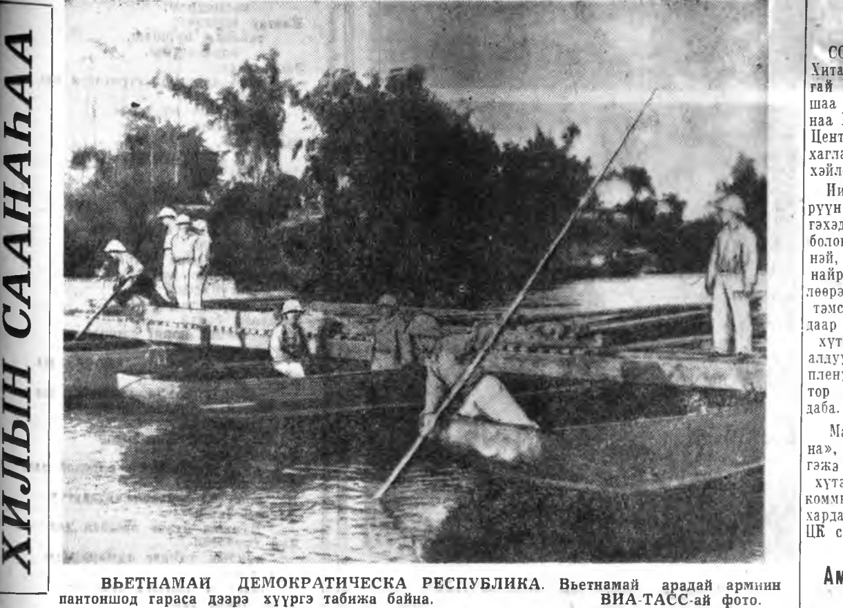
ВЬЕТНАМАЙ ДЕМОКРАТИЧЕСКА РЕСПУБЛИКА. Вьетнамай арадай арминин пантоншод гараса дээрэ хүүргэ табижа байна.

ХАНОН, сентябрьн 2. (ТАСС). Урда Вьетнамые сүлөөлэхэ армин сэрэгшэд августын 25-дэ Ратхиз провинцида дайлагдааха хархис сэрэгүүдэ намна бага сохилон байна. Эдэнэр дайсанай 250 солдатуудые үгы хэһэн гү, али шархатуулан байна. Тэрэнһээ гадна, энэхин патриотууд американска нэгэ самолёт бууджа унагаага, хэдэн самолётньёе хандлаага гэжэ ВНА агентство мэдээсэбэ.