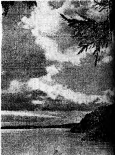
Байгал далайн эрьбэд үлдэж явахалда, эхм даа. Фотопарадаа гаргаад, буулгамал буулга мэдэхш. Удэһын наран залирхала байна. Далайн диминдаһан-утаһадаа үлхэнэ. Загаһанд далайда гарахала бэлдэнэ. хангал лаг яранад. Чивернуй гэгдэһэн тадхалай эрьбэд зогсоуулдай угалза татан нүүхые харахаш.