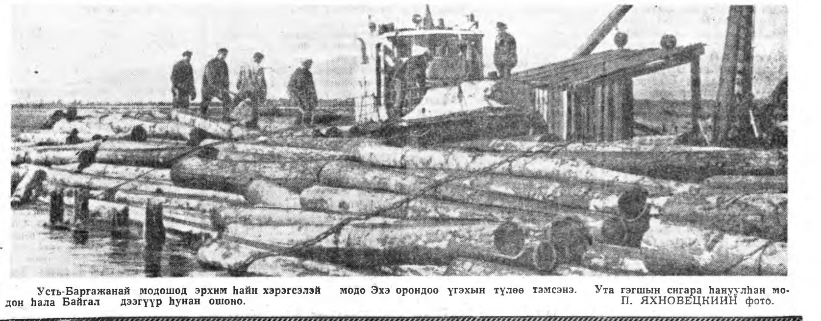
Усть-Баргажанай модошод эрхим һайн хэрэгсэлэй модо Эхэ орондоо үгэхын түлөө тэмсэнэ. Ута гэгшын сиграа һануулан моп.