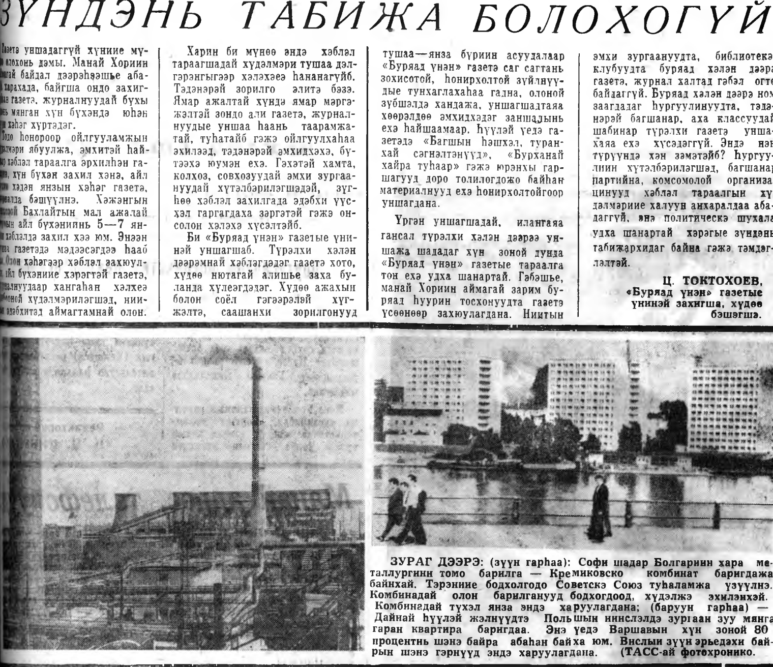
ЗУРАГ ДЭЭРЭ: (зүүн гарһаа) Софи шадар Болгарин хара металлургин томо барилга — Кремниково комбинат барилдажа байһаг. Тэрэнине болдогдоо Советск Союз туналмажа үзүүлнэ. Комбинатай олон барилганууд бодогдоод, худалжа эхилэхэй. Комбинатай тухал янаа энде харуулагдана; (баруун гарһаа) — Дайнай хүүдэй жэлүүдтэ Польшын нинслэдэ зургаан зуу мянга гаран квартира барилдаа. Энэ үедэ Варшавын хүн зоной 80 проценти шонэ байра абанһаа байх юм. Вилшын зүүн эрьдхэй байрын шонэ тэрүүнд энде харуулагдана.