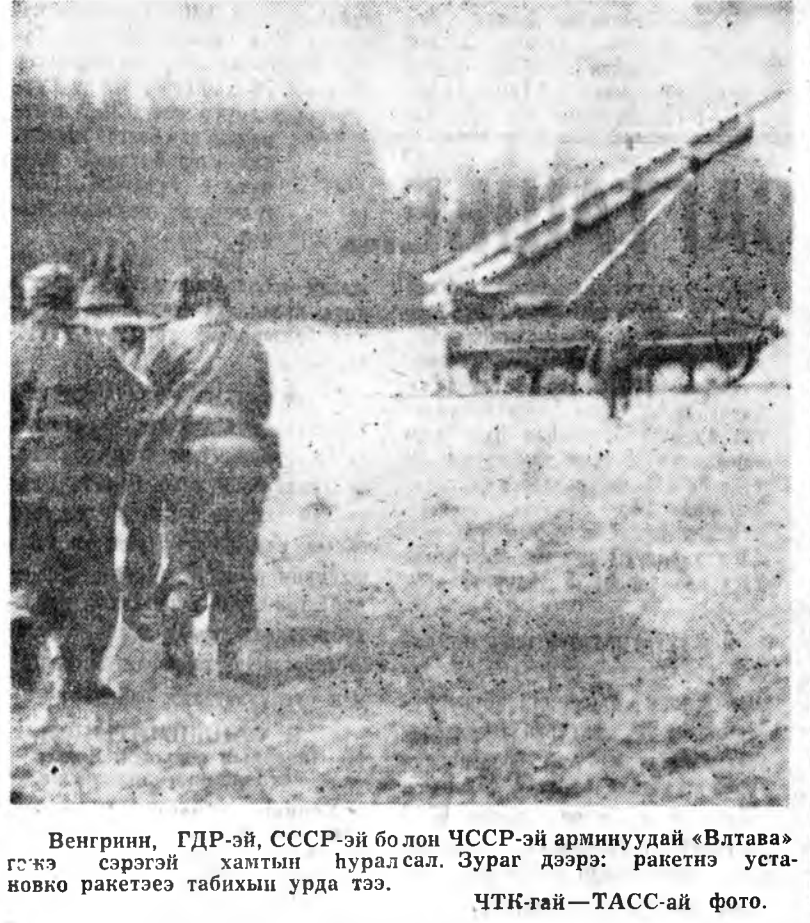
Венгрийн, ГДР-эй, СССР-эй болон ЧССР-эй арминуудай «Влтава» гэжэ сэргэй хамтын нуралсаа. Зураг дээр: ракетнэ установка ракетээ табиын урда тээ.