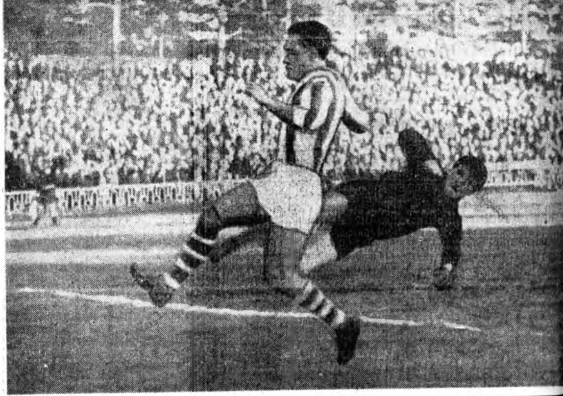
Нааданай дүүрэтэр «Сэлэнгэ» үшөө дүрбэн уулзалга хэбэ байна. Эдэ уулзалгануудаа эрхим хайнаар үнгэргөө наа, зоно соогоо туруу хууринуудай нэгнэ ээлжэ магадгүй...