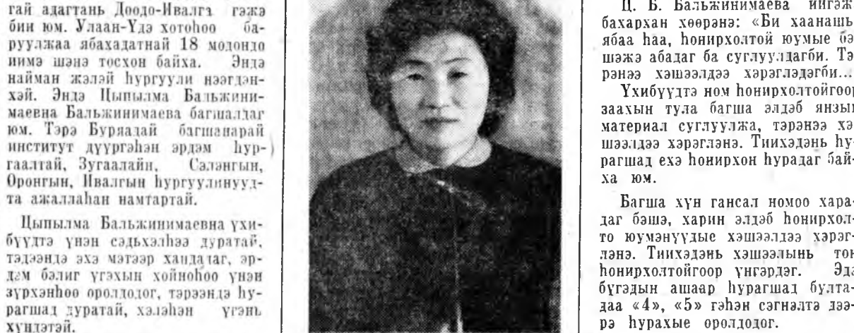
Эдэ мэтын онһон үгэ таабаринууд хашээлдэ өмнө наган грамматическа дүрмдэ үгтэнэ. Хурагалд эхэ һонирхолтойгоор бэшлэг, дүрмөө ойлгохонд тухатай байха юм.

«Эдихэдэ шүдэн яараха, дуулахда шөхөн яараха» гэжэ урданай эон хэлсэдэг байһан. Наарашы байн юмэ дуулаха шөхөн яарадаг гэшлэ ха.